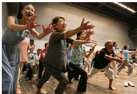
Vue d'une répétition

Le spectacle s'est tenu le mercredi 7 décembre à la Super Arena Saitama. Les 1 600 personnes environ qui sont montées sur scène ont ainsi donné vie à une pièce de théâtre en grande foule sans précédent à laquelle environ 8 000 spectateurs ont assisté.