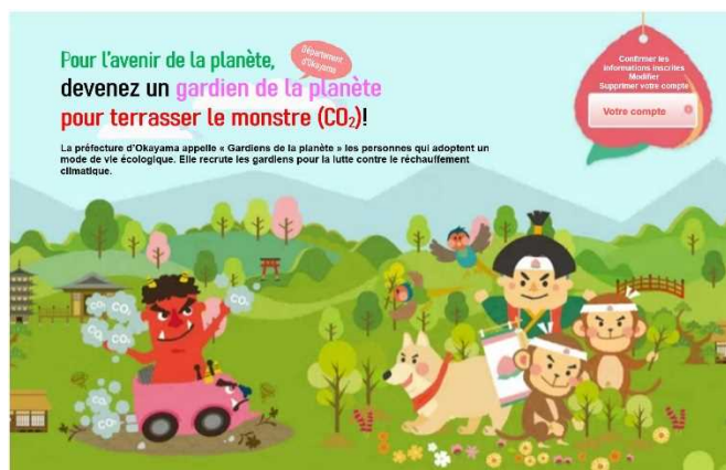
Site internet du système des Gardiens de la planète