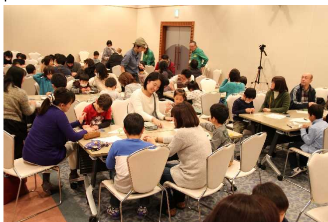
Événement réservé aux membres