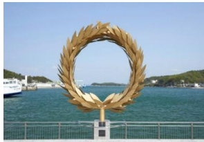
【瀬戸内国際芸術祭】