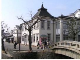
【倉敷美観地区街並み】

美観地区景観条例により保全された街並み、日本最初の西洋美術館大原美術館等、古い歴史文化の中に現代の人々の生活を調和させた倉敷市の街づくりを視察します。