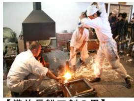
【備前長船刀剣の里】

旧閑谷学校の精神を現代に引き継ぐ和気町、1千年前から釜の火を絶やしたことのない備前焼窯元、そして鎌倉時代から刀鍛冶として栄えた長船町。 伝統を絶やさず後世に伝えていく3つの地域の取り組みをご覧ください。