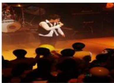
韓流文化 公演伝播