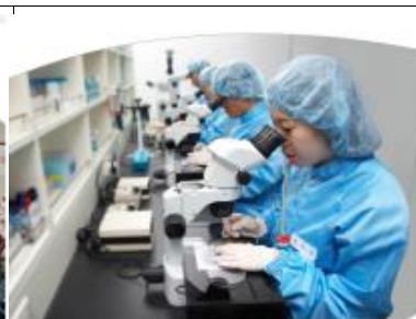
スアム生命工学研究院