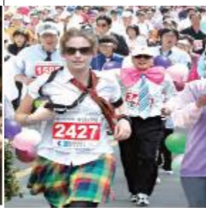
ネクタイマラソン