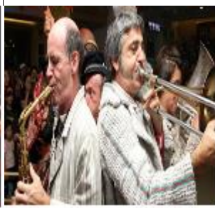
フランス文化祭り