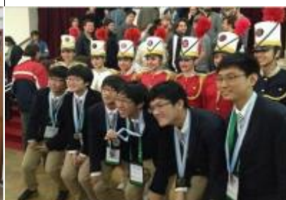
国際数学オリンピック優勝