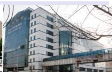
九老文化センター