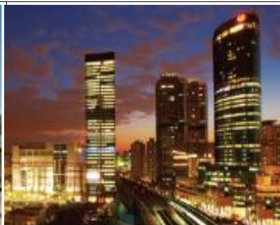
ディーキューブパーク