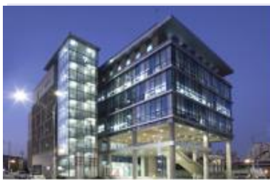
九老アートバレー公演場