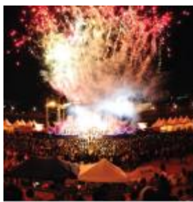
ジャンプ九老祭り