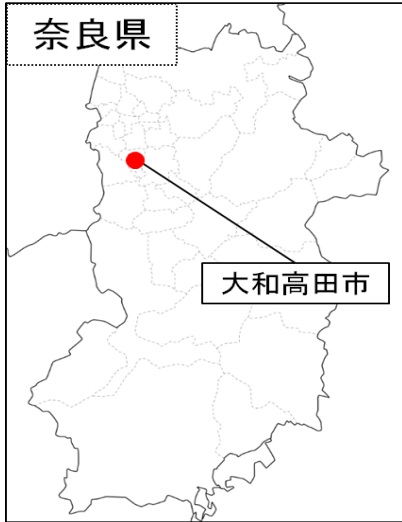
やまとたかだし ○大和高田市（奈良県）