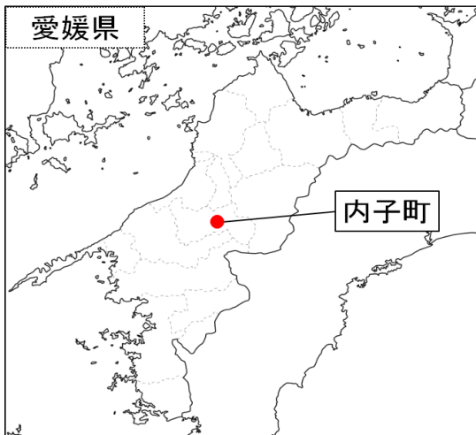
うちこちょう ○内子町（愛媛県）