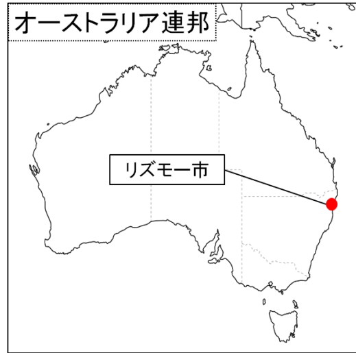
○リズモー市（オーストラリア連邦）