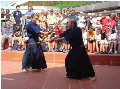
ローテンブルク市で開催した「内子フェア」 では、様々な日本文化を紹介