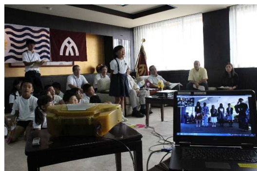
スカイプでの交流