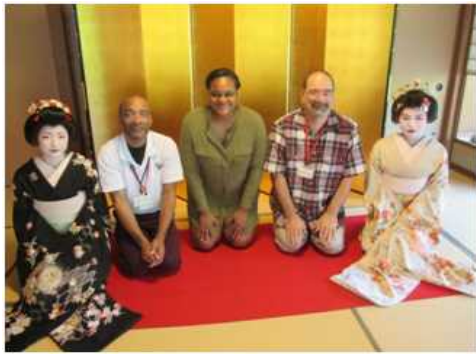
ガルベストン市使節団が「新潟芸妓の舞」を鑑賞