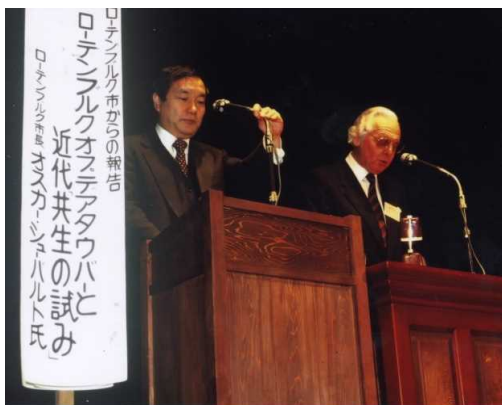
交流のきっかけとなった「内子シンポジウム'86」