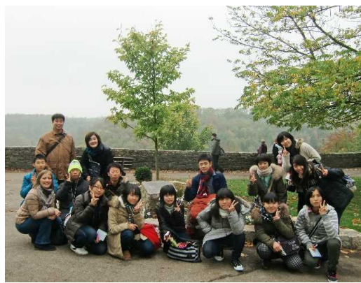
姉妹都市盟約締結の記念樹の前に立つ 第20回青少年海外派遣事業の団員