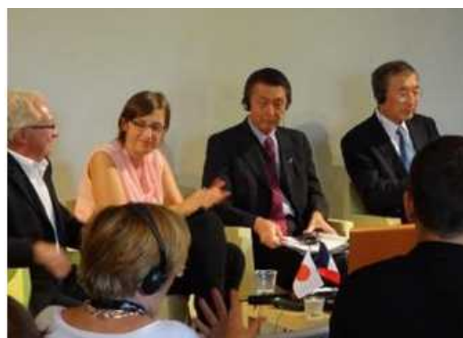
ナント市で「日仏都市・文化対話」を開催