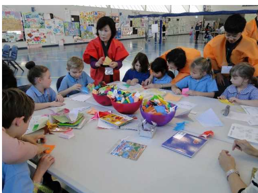
50周年の年に、市民訪問団員がリズモー で折り紙を教えている様子