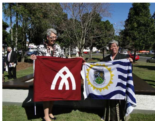
姉妹都市締結50周年の年に、両市長がリ ズモーで市旗を交換