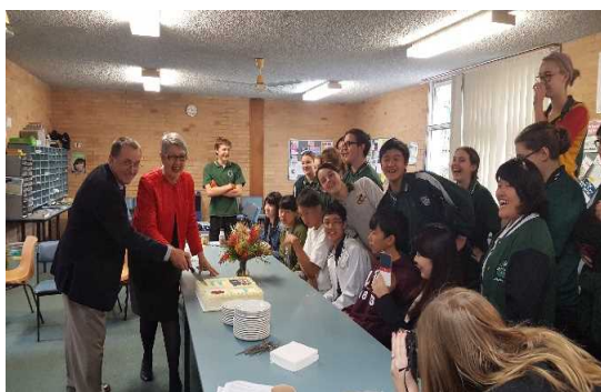
リズモーで開催された交換学生歓迎パー ティー