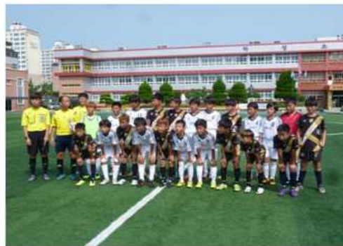
ウルサンで行われた少年サッカー交流