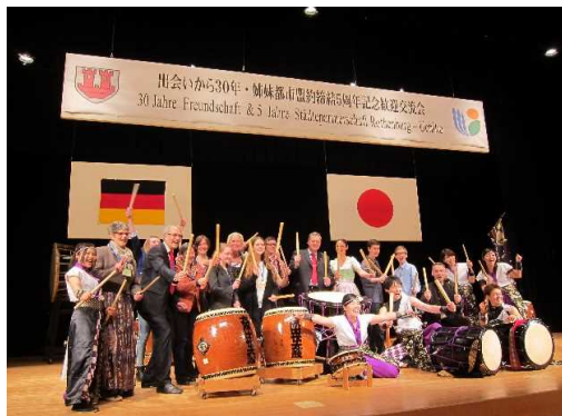
内子町で開催した歓迎交流会では、 和太鼓演奏の体験も！