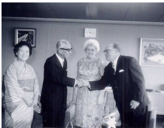
姉妹都市連携の調印をした翌年、当時の リズモー市長が親善のために、大和高田 市を公式訪問