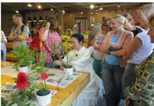
ウラジオストク市で「いけばな」ワークショップなどを開催