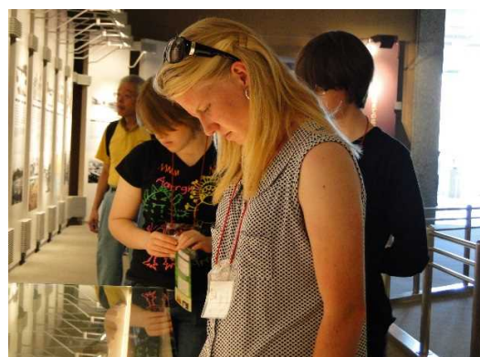
広島平和記念資料館での平和学習