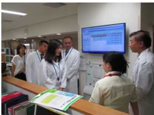
ハルビン市の医師らが新潟市民病院で研修を実施