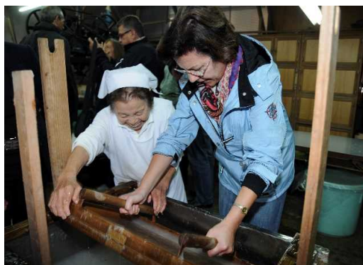
内子町特産の手漉き和紙を体験