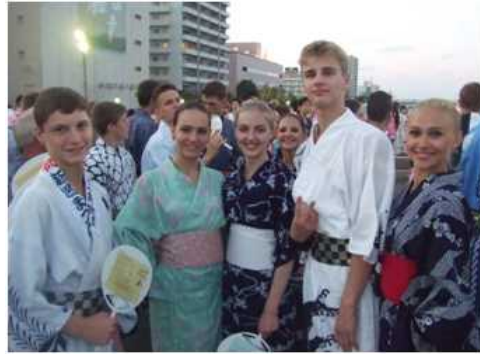
ハバロフスク民族アンサンブルが新潟まつりに参加