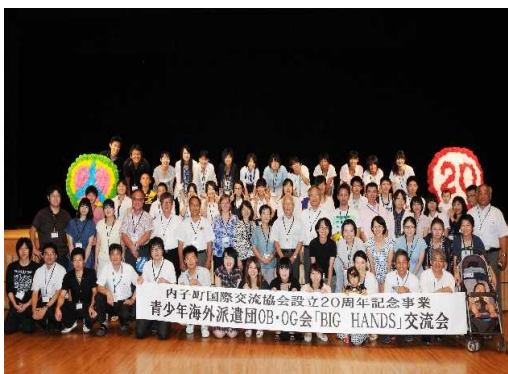
海外派遣OB・OG交流会（2004年8月） OB・OGは現在合計289人