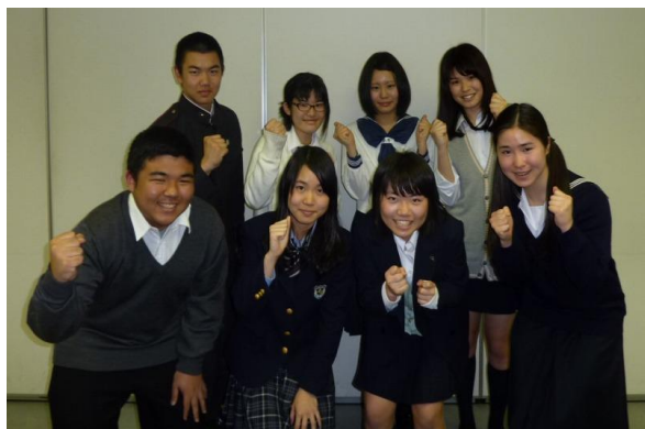
横須賀市を代表する 8 名の「熱い」高校生たち (平成 23 年度姉妹都市派遣学生)