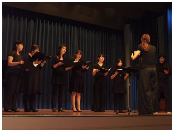
5月29日に行われたチャリティーコンサート