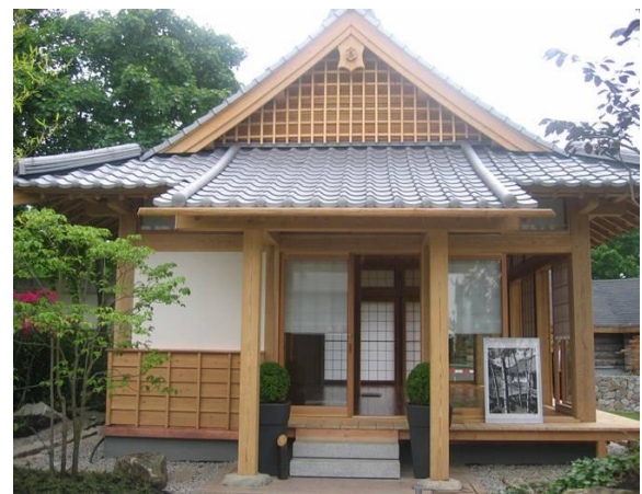
ヴィタ・クラシカ(バート市のスパリゾート施設)にある日本建築の休憩所