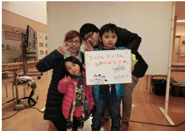
釜石市民からディーニュ市に届けた「ありがとう」のメッセージ