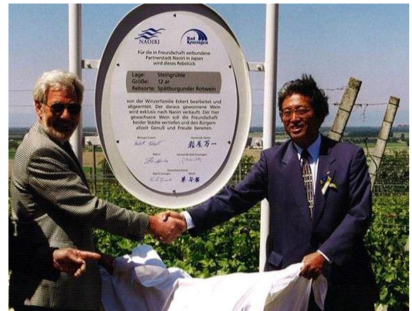
バート市から竹田市へブドウ畑が贈呈