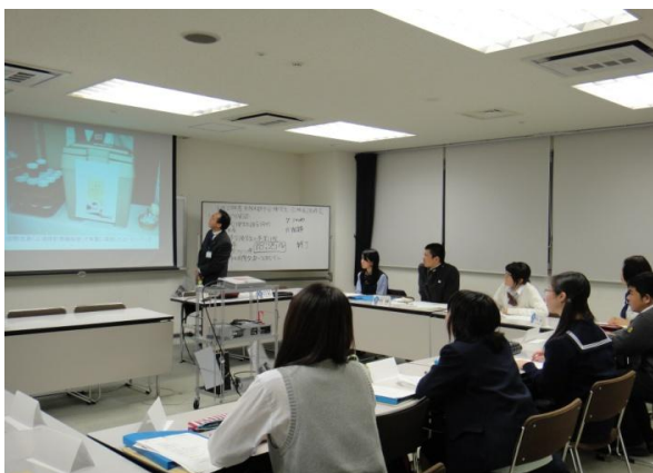
派遣準備研修でフェアトレードに対する理解を 深める