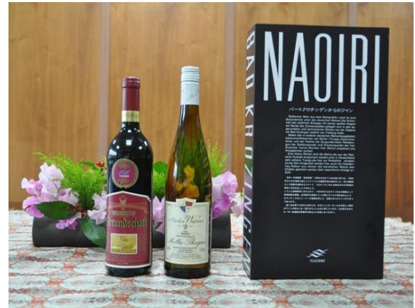
竹田市で限定販売しているドイツワイン