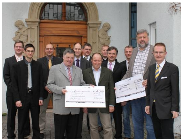
1000 ユーロを募金したバート市の営業組合