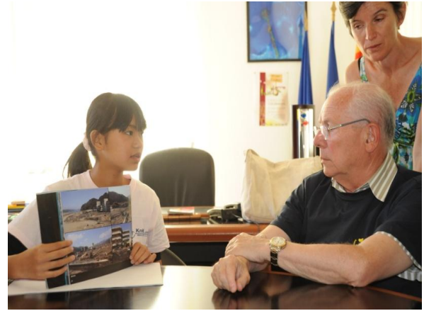
ディーニュ市長に被災状況を伝える釜石市の中学生