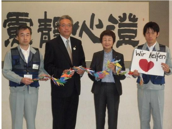
折鶴と絵画を仙台市長へ