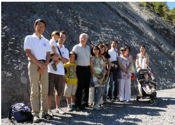
アンモナイトの壁とディーニュ市に招待された在仏邦人