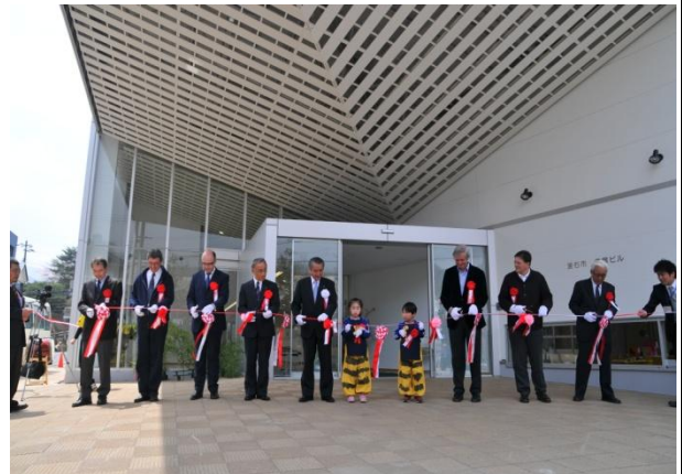
姉妹都市が縁で支援をいただき復旧した釜石市のコミュニティー施設。