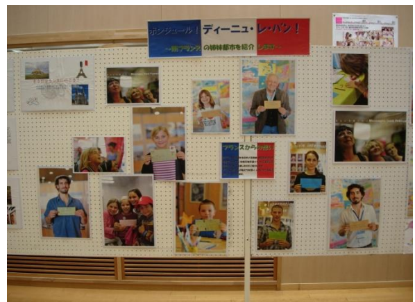
ディーニュ市を始めフランスから届けられた応援メッセージ