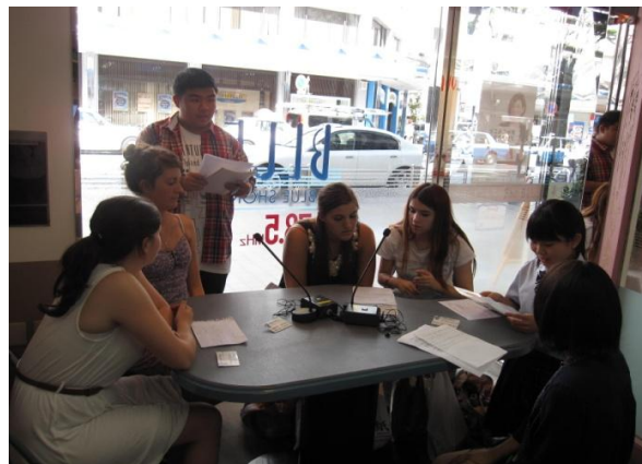
地元放送局で来日した姉妹都市の学生とともに PR 活動を行う