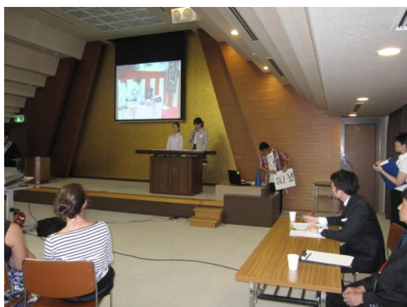
国際ユースフォーラムで姉妹都市派遣学生の 相互の意見交換と交流活動