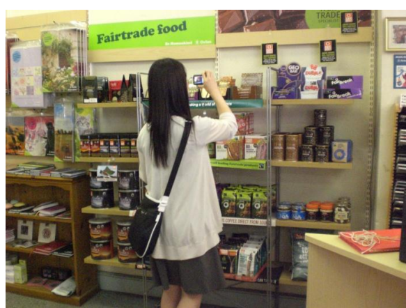
派遣先の英国メッドウェイ市でフェアトレード製品 の調査を行う交換学生