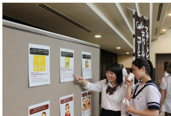
国際ユースフォーラム会場のフェアトレード説明 パネルと姉妹都市派遣学生