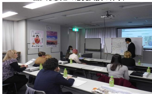
(JR 東日本による講義の様子)