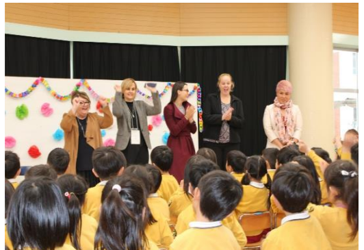
(園児との交流の様子)

その後、職員から幼児教育センターでの教育について説明があり、質疑応答では「体験的な活動が多いのは、日本の幼児教育では一般的か」、「この町の規模で200人も児童がいることは驚き」との発言があった。