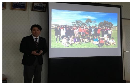
(江北町長の行政説明の様子)

東京セミナーで日本の地方都市の現状について学んでいた参加者たちは、少子高齢化の時代にありながら江北町が人口維持できている理由や町の戦略に興味津々だった。その他、若者の大都市流出や雇用創出といった参加者の自治体に共通する課題についてもたくさんの質問が飛び交った。