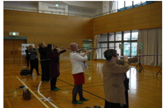
(スポーツ吹き矢を体験する様子)

「ネイブル」は、多目的ホール、コミュニティセンター、保健センターの3つの施設から構成されており、スポーツや文化活動、健康づくり、各種イベントなど様々な用途に利用されているとの説明を受け、実際に箏教室、料理教室、図書館を視察し、体育館においてスポーツ吹き矢を体験した。