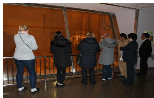
(巨大な施設でのごみ処理を視察する様子)

巨大な施設でのごみ処理の様子を食い入るように見学されていたのが印象的であるとともに、広域連合による運営では自治体ほどの程度の財政的な負担があるか、広域連合の意思決定はどのように行われるか等、質問は財政面や広域連合の仕組みにも及んだ。