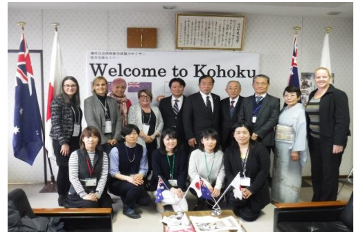
(江北町長、議長はじめ職員の皆様と)

その後、町議会議員控え室にて町長表敬が行われた。町長だけでなく町の幹部の方々がそろった中での表敬で、町長、団長、議長の挨拶の後、記念品の交換、アテンド職員の紹介（参加者一人ひとりにセミナー期間中、担当職員をつけてくださった。）が行われた。