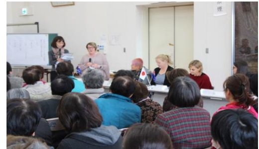
（意見交換会の様子）

今回、参加者が全員女性だったこともあり実現した視察だったが、女性ネットワークの会から多くの女性が集まるこの会合に、参加者から「江北町でこのように女性たちが議会へ要望する場があるということは大変よいと思う」といった感想が聞かれた。