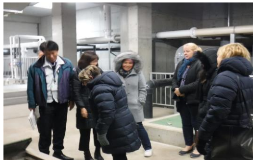
（下水道終末処理場にて）

また、日本で全国的に行われているマンホールカード配付の取組についても説明を受けた。