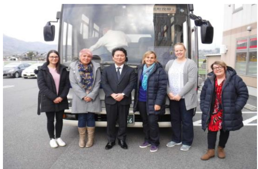
(見送りに来てくださった町長と)

朝早くにも関わらず出発前のホテルまで見送りに来てくださった町長、空港まで来てくださった副町長はじめ町の方々温かさに再度触れ、名残惜しさを感じながら東京へと移動した。