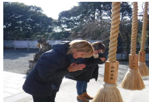
(武雄神社での参拝の様子)

神社もさることながら、武雄神社には樹齢3000年の大楠もあり、その神聖な様子に参加者たちは感動している様子だった。