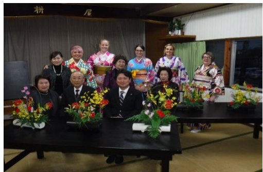
(生け花・着付け後の記念撮影)

また、着付けでも「一度着てみたかったの!」「これを着ると日本人になったみたい」等と大喜びで写真を撮りあっていた。