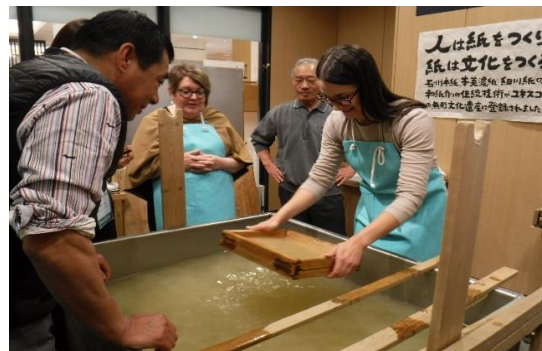
(土佐和紙の紙すき体験の様子)

初めての体験にもかかわらず、参加者はためらったりすることなく楽しそうに次々と作業を進めていた。自分が作ったきれいな和紙が完成すると、参加者からは満足そうな表情がみられた。