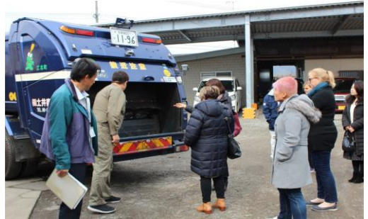
（ごみの収集運搬車について説明を受ける参加者）

参加者は非常に環境意識が高く、「別のごみが混入している場合は回収するのか」、「ごみ袋は土に還るものか。燃やしたら有害ではないか」、「コンポストを使つての肥料化はしているのか」等の質問がなされた。