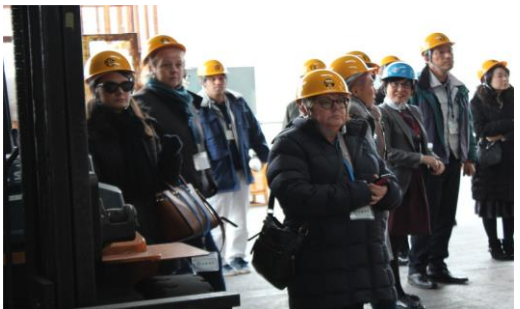
（ごみの分別の機械を視察する参加者）

参加者たちの自治体でも、中国へのごみ輸出が全面禁止になったことを受け、埋め立てをいかに減らすかが課題となっていることもあり、終始熱心に視察し、たくさんの質問をしていたのが印象的だった。