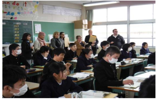
(中学校の授業を視察する様子)

江北町では、昨年秋に江北中学校とオーストラリアのエンカウンター・ルーサランカレッジとの間で学校交流を始めたこともあり、直接交流する時間はとれなかったが、生徒たちも好奇心を持っている様子で温かく参加者を迎えてくれた。