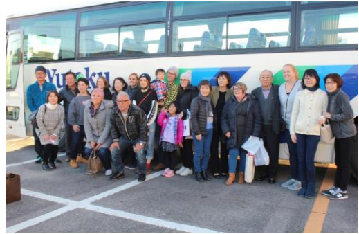
(ホストファミリーの皆さんと)

戻ってきた参加者たちは、餅つきや地元の方々とのバーベキュー、お茶会、書道等、ホームステイ先でそれぞれが体験したことの思い出話で大盛り上がりで、たくさんの写真や子どもたちに描いてもらった自分の絵を嬉しそうに見せる等、充実した表情を見せていた。