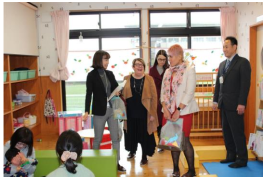
(こどもセンターうるるにて)

指定管理者による運営がなされており、児童厚生員を雇ったり、民間のノウハウを生かした運営がなされている点に参加者たちは関心をもって質問をしていた。