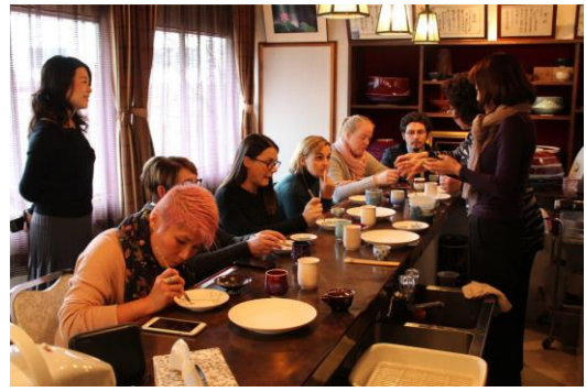
(有田焼の絵付け体験の様子)

絵付け体験の後、お店の方がろくろを回す様子を見学し、佐賀に古くから伝わる文化を体感した。