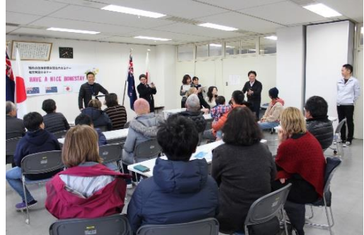
(ホストファミリーとの対面式の様子)

地方セミナー初日に、多くのホストファミリーが歓迎夕食会に参加していたこともあり、この日は多くの参加者が既に打ち解けた様子で、安心した表情でホームステイへと出発していった。