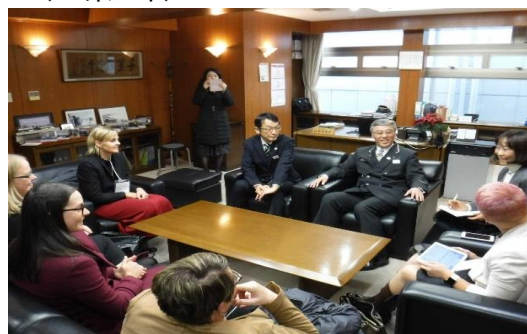
(品川駅長との意見交換の様子)

質疑応答では、「東京には今でも多くのビルやマンションが建ち並んでおり、さらなる建設に需要はあるのか」、「新しいタイプのモビリティが充実してくると公共交通に対するニーズが下がってくるのではないかなど、多くの質問がなされた。