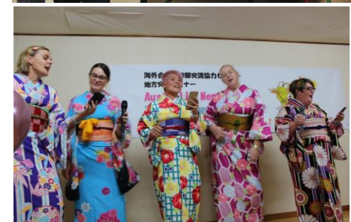
(歓迎レセプションの様子)