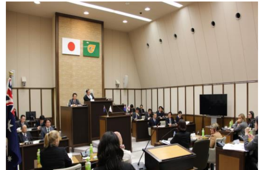
(議場での意見交換会の様子(上)と意見交換会後の記念撮影(下))

参加者からは意見交換会後に「江北町の職員等の正直さに感謝している」との感想が寄せられたほか、予定していた3時間があったという間に過ぎたことから「もう少し時間が欲しかった」、「もっと自由に意見“交換”したかった」といった声もあったが、すべての参加者が満足しており、有意義な意見交換となったといえる。