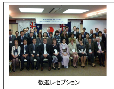
歓迎レセプション

岡山国際交流センター内で、ボランティアやホストファミリー等を交えてのアットホームな歓迎レセプションは、オーストラリア・ニュージーランドにちなんだクイズ大会もあり、参加者もとてもリラックスでき、和やかな雰囲気となった。