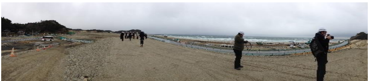
豊間・薄磯地区（高台移転）

豊間・薄磯地区の津波被災地は、参加者が最も感銘を受けた視察先であり、セミナー中で雨風が一番激しい時間帯であったため、より現場の厳しさや当時の状況を想像させられた。市の職員から震災前と工事後のイメージについて説明を受け、以前避難者が居住していたアパート内を見学した。参加者は、現在でも更地に近い状況を見渡し、公営住宅の自治会長との歓談では、自治会長をはじめ住民の地域に対する想いに心を揺さぶられつつあった。