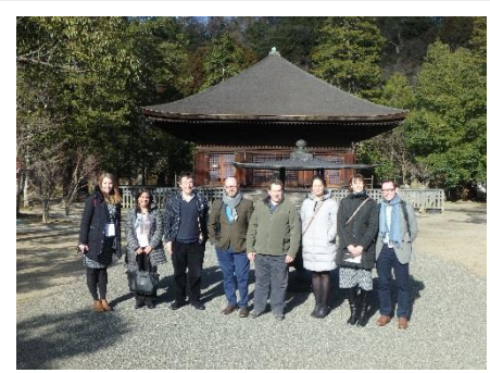
白水阿弥陀堂視察

国宝白水阿弥陀堂では、手水や参拝の作法、マナーなどを学び、雪こそは積もっていなかったが冬の静けさを上回る日差しと日本庭園が生み出す独特な空気に囲まれ、館内を廻った。願城寺内も見学することができ、参加者は寺院用仏具に興味を持たれていた。