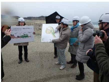
海岸堤防嵩上げ工事視察