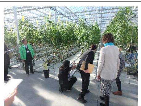
ワンダーファームトマトハウス視察

トマト栽培の技術及び加工工場の視察をした。ワンダーファームで育てた野菜やトマトジュースを試食させていただき、事前に農産物モニタリング検査を見学した参加者は、栽培技術の地道な作業に感銘を覚え食材によりありがたみを感じたようだった。いわき市内における最新施設（2016年2月開園）のなかでも、ビュッフェレストラン、直売所、カフェ、加工工場、ガーデン、農園里山、多目的イベント広場等と観光要素が様々で、観光客のみならず地元の人々を呼び寄せるいわき市の魅力が揃っているとの声が多数あった。