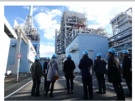
常磐共同火力発電所視察

燃料炭の運輸から施設全体の働きをについて講義を受けた後、作業現場の視察を行った。火力発電所の面積は、燃料炭の保管場所も含むため歩き廻るには広すぎるが、日々の発電に纏わる燃料炭量、管理システムが想像よりも小規模な現場に参加者は衝撃を受けていた。