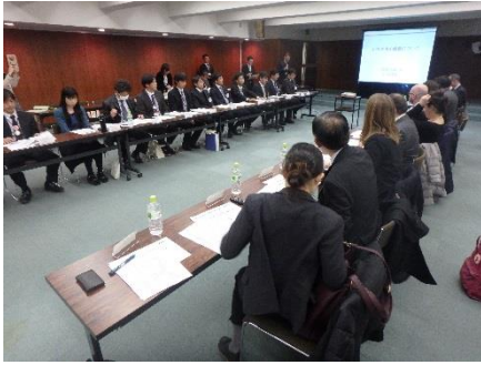
いわき市による行政説明

セミナーテーマに関係するいわき市計10課より概況及び市の取り組む観光や復興に関するまちづくり、地域レベルでいわき市特有な施策（原子力防災体制、農業・水産業における風評被害対策）の概要について説明を受けた。参加者からは、英国内自治体の状況や抱える問題に比べ、日本の自治体制の中で企業との連携が整っていると総合的な意見があった。