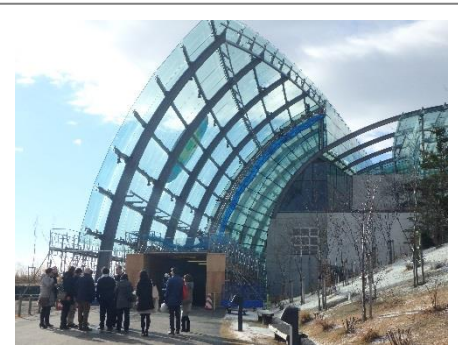
アクアマリンふくしま視察

小名浜の沖沿いに位置するアクアマリンふくしまとその近辺の視察を行い、震災当時の様子と閉館から開館までの経緯についてお話をいただいた。地震の影響もあったが、津波により地上1階が水没したため、津波による損傷の方が大きく、現在工事中の箇所における今後の展開について説明を受けた。しかし、震災からわずか4か月ほどで開館したアクアマリンふくしまは、綺麗に再構築されており、津波の影響が一切見られない館内とイキイキとした水生生物の観察に参加者は目を囚われていた。