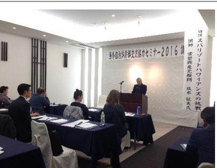
常磐興産による講義

常磐興産の取り組みについて講義を受け、参加者の一番印象に残る講義となった。「炭鉱から観光へ」というコンセプトに、イギリスでこのような事例はないと感心された。また、スパリゾートハワイアンズ館内視察の際に、壮大な設備とアトラクションの完成度はもちろんだが、設立当時の意図、東日本大震災当時の支援対策と立ち直りの速さ、そして現在も続く地域を活かした復興に向けた試みに感激されていた。