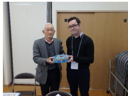
公営住宅の自治会長と歓談