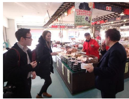
いわき市の海産物を試食する参加者