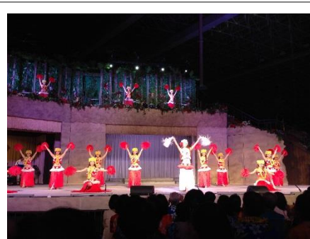
館内を盛り上げるアトラクション