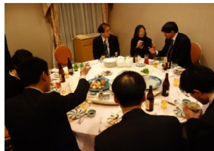
長野県歓迎夕食会