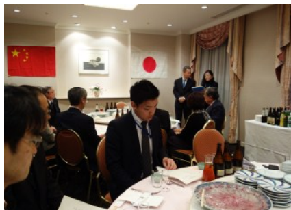
長野県歓迎夕食会

長野犀北館ホテルにて、長野県主催の歓迎夕食会が開催された。夕食会には、長野県や長野県日中友好協会の代表の方が出席した。