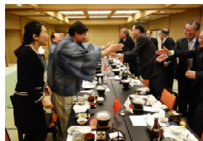
松本日中友好協会夕食会

ホテル翔峰にて、松本日中友好協会主催の夕食会が開催された。参加者、松本日中友好協会、松本市、相澤病院、長野県の出席者が互いの親交を深めた。