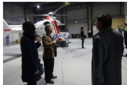
佐久医療センター視察

佐久医療センターでは、現在にいたる村民の健康管理活動の歴史を紹介していただき、上下移動が少ないように工夫させている病院のレイアウト、ヘリポート及び救急車スロープ等を見せていただいた。