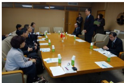
阿部知事表敬訪問

長野県行政説明においては、衛生技監と国際課長による説明があった。長野県が取組んできた「減塩活動」について、活発な意見交換が行われ、河北省との交流事業についての紹介があった。