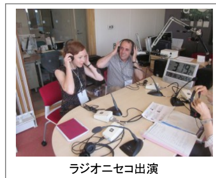
ラジオニセコ出演