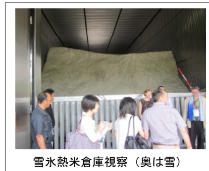
雪氷熱米倉庫視察（奥は雪）

図書館機能と情報公開に対応した公文書の保管・会時場所の機能を併せ持っている施設。運営は町民が組織しているNPOが行っているということで、運営方法について特に関心を示しており、意見交換を行った。