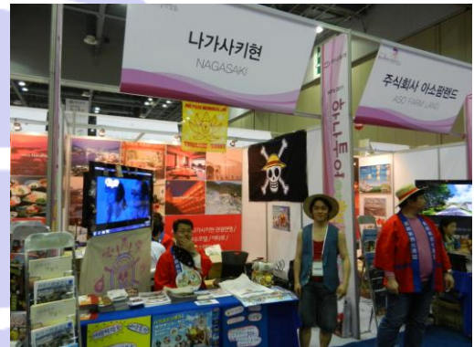
各県等の個別ブース

また、より日本に親しみを持っていただくため、韓国では接することが難しい芸妓姿による舞踊の公演や、各種イベントが行われ好評を博しました。