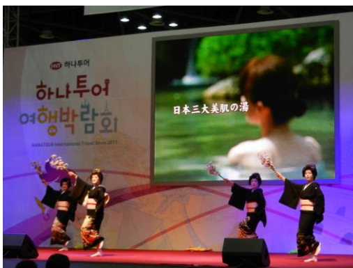
舞踊の公演(共通大舞台にて)

また、より日本に親しみを持っていただくため、韓国では接することが難しい芸妓姿による舞踊の公演や、各種イベントが行われ好評を博しました。