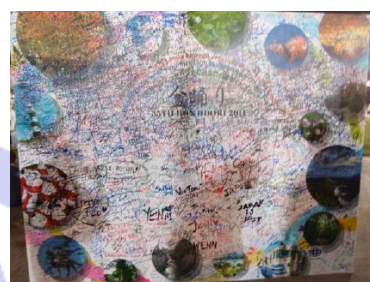
来場者からの寄せ書き

今年 35 回目の開催となったこの盆踊り大会は、クアラルンプール日本人会、クアラルンプール日本人学校、在マレーシア日本国大使館の共催により、2011 年 7 月 16 日（土）、マレーシア・スランゴール州シャーアラム市のスポーツ競技場で行われ、およそ 35,000 人が訪れた。