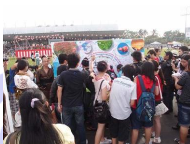
展示パネルの様子