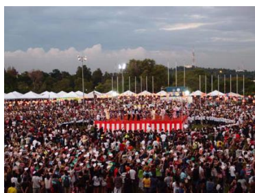
熱気溢れる盆踊り会場

東日本大震災発生以降、各国から日本に対し暖かい支援が寄せられた一方で、ニュース映像等からの影響で、暗いイメージを持つ人は少なくない。そこで当事務所では、地域支援の一環として、マレーシアで開催された大規模な盆踊り大会に、マレーシアからの被災地支援に謝意を表すパネルと寄せ書きボードを設置するとともに、被災地域の支部より提供を受けた写真等を紹介し、復興に向けたPRを行った。