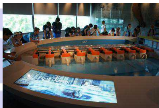
堰の模型により機能の説明を受ける

今回の視察を通して、シンガポールの情報発信は、小さな都市国家であるが故、どのように国内外にその存在をアピールするか、自国をよく理解した上で行われている情報戦略であるということを感じました。