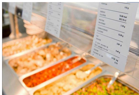
バイキング形式となっており、各メニューにはカロリー数や各栄養素がどのくらい入っているかなどが記載されています。