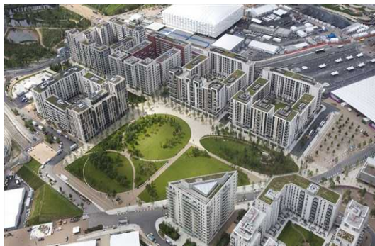
選手村の外観。それぞれの居住スペースが区画で分けられています。中央は広々とした共同スペースとなっています。

選手村の建設は 2008 年 5 月に始まり、約 4 年の歳月をかけて 2012 年 6 月に、オリンピックパーク内に完成しました。選手村には、おおよそ 17,000 人の選手及び関係者が滞在する予定で、アパートメント式及び住宅式の居住スペースが 11 区画あり、食堂、医療施設、娯楽施設、インターネットを利用できる施設、各種店舗、広大な共同スペース等が完備されています。特に、共同スペースは友人や家族との時間を楽しむためのスペースとされており、家族との時間を共同スペースで楽しむロンドンの慣習が反映されています。またストラトフォード駅やストラトフォード国際駅に隣接しており、地下鉄や電車、バスなど公共交通機関でのアクセスが便利です。