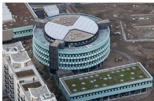
Chobham Academy の外観

選手村については、大会終了後、居住スペースは、各部屋にキッチンが導入されるなど整備された上で、半分を民間の住宅、半分を政府出資の公営住宅として提供し、約 2,800 世帯が住めるようになります。また、選手村に隣接する形で「Chobham Academy」と呼ばれる 3 歳～19 歳までの生徒が学べる 1,800 人規模の学校や、医療センターが設けられ、居住スペースと併せて一体のコミュニティとして活用される予定です。