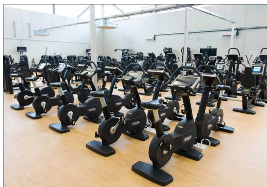
トレーニング施設の様子