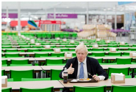
食堂の様子。食事は、2万5000斤のパン、100トンの肉、7万5000リットルの牛乳、330トンの野菜と果物が使用され、合計1400万食が提供されるそうです。