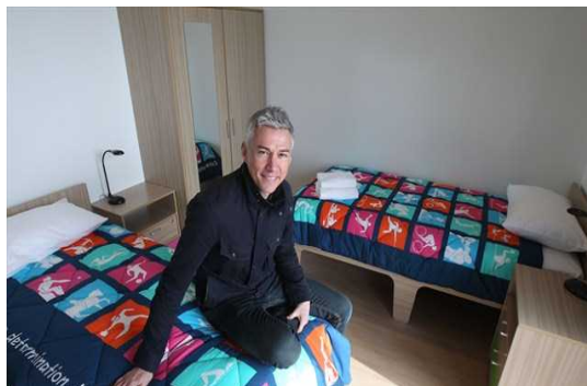
部屋(寝室)の様子。アパートメント式は2人で1ベッドルーム1部屋が基本。