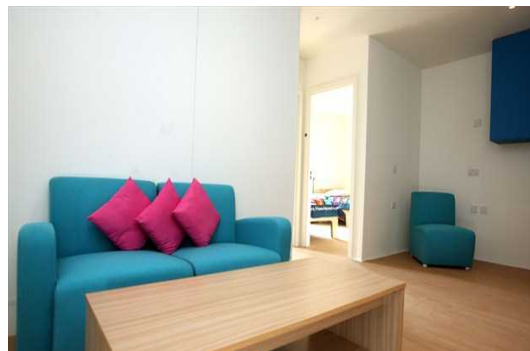
部屋(リビング)の様子。