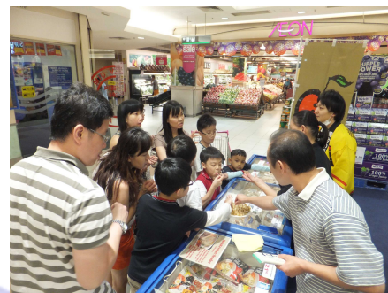
海産物（ほたて）の試食をする来場者

現地のマレーシア人（主に中華系）はもちろんのこと、近年増加しつつある、定年退職後のセカンドライフをマレーシアで送る日本人夫婦の姿も見られ、「毎年の開催を楽しみにしている。」「通常販売していない日本の地方特産品が購入できうれしい。」といった声も聞かれました。