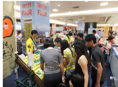
シナノゴールド販売風景（手前の黄色のりんご）

最も人気のあった品種は「シナノゴールド」でした。販売した品種のうち、通常日本で最も人気のあるものは若干酸味が強く、果肉が硬めの「サンふじ」ですが、マレーシアでは「シナノゴールド」のシャキシャキとした食感と、甘さ・酸っぱさが程よくマッチしている風味が大変受け入れられていました。