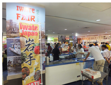
各会場に掲げられたのぼりと看板

以前、マレーシアでは、岩手県ブランドがあまり確立されていない状況でしたが、第 1 回の開催時において実施した同県知事によるトップセールスを契機に、当フェア等を通じた有望な海外マーケットの一つとして期待されてきており、先行利益を獲得するため、同県は他都道府県に先駆けた現地での販売活動促進を展開してきました。