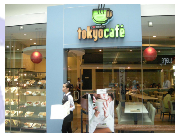
ショッピングモールの日本風カフェ

フィリピンの方には、アメリカ、日本、シンガポールといった先進国に対する憧れがあり、第二次世界大戦の舞台となったにも関わらず、現在の対日感情は良好と言えます。街を走る車に日本車が多いばかりでなく、高級ショッピングモールには日本食のレストランや日本ブランドのお店が並んでいます。日本食に関しては高級路線だけでなく、