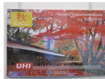
訪日取扱大手旅行社の広告

今回の TME でも、東京周辺または東京と大阪のツアーは人気がありましたが、高価格帯の商品であるため、現段階では購買層はほぼ富裕層に限定されています。訪日旅行の人気商品に影響されて、ブースを訪れるお客様も主に東京・大阪・京都の情報を求める方が多いのですが、フィリピンでは、現在これら人気旅行地に続く地域が予測できない状況です。