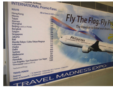
会場内の参加航空会社広告。左からデルタ航空、全日空、フィリピン航空。各社とも日本線も掲載。