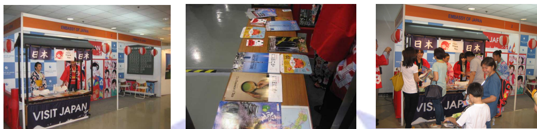
(左から) 開場前の日本ブース、各地のパフレット、開催中の日本ブースの様子