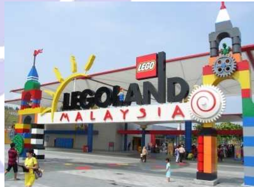
2012 年にオープンしたレゴランド

イスカンダル地域では、観光産業や教育産業の集約も積極的に進めています。教育分野においては、ヌサジャヤ地区を教育特区として、海外大学を多数誘致しており、2012 年までにニューキャッスル大学、マルボロカレッジ、サウサンプトン大学などのキャンパスが開設されています。また、これらの大学に通う大学生のための寮の整備や小中学校の開設も進められており、教育都市としての魅力も高まっています。