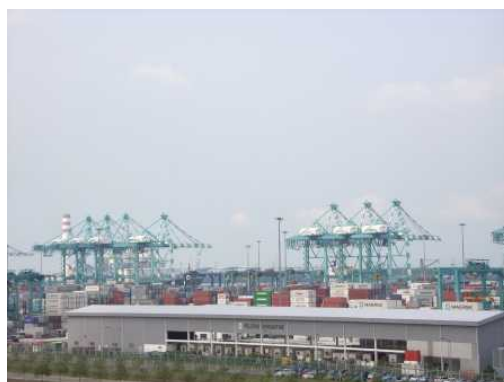
タンジュン・プルパス港

また、同港内には、発電所や石油化学工場などの整備が進められており、従来の製造業に加えて重化学分野での成長も見込まれています。