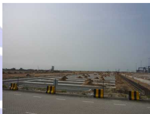
整備が進む Free Zone 用地