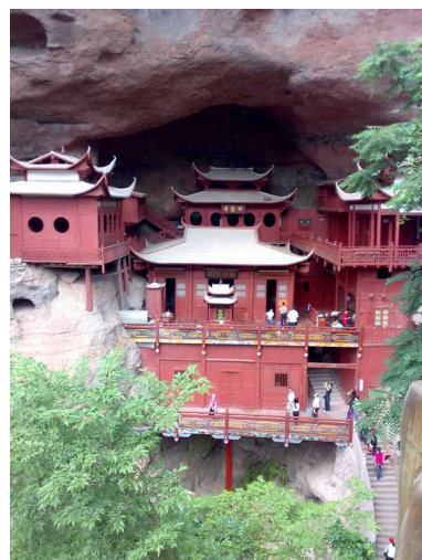
江蘇省・鎮江の「甘露寺」