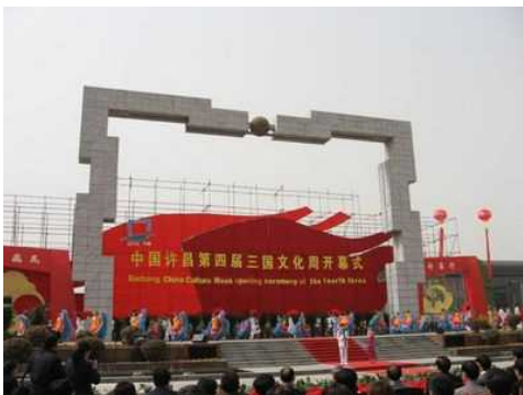
許昌の「三国文化ウィーク」

また、南陽市は「諸葛孔明祭り」を何回も挙行しているほかに、9 億元(約 112.5 億円)を投資して諸葛孔明が住んでいた臥竜岡を整備し、『南都賦』に基づいて観光施設を建設しています。