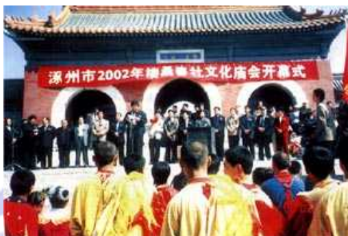
河北省涿州の「楼桑春社文化縁日」

中国は三国文化の発祥地であり、三国遺跡を数多く有しているため、経済発展とともに文化や観光分野における市場ポテンシャルが大きいと見込まれています。一方、日本には三国文化が深く浸透しており、三国志をテーマにしたアニメなどコンテンツ産業が進んでいます。この三国文化を軸にして、今後益々両国は観光、文化、コンテンツ産業等の分野における更なる協力が期待できると思います。