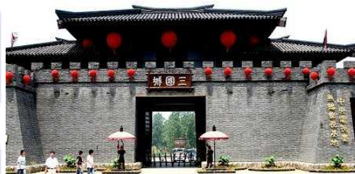
無錫太湖の「三国城」ロケ地