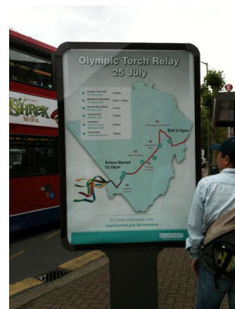
近所のバス停の広告スペースも聖火リレーの地図に。