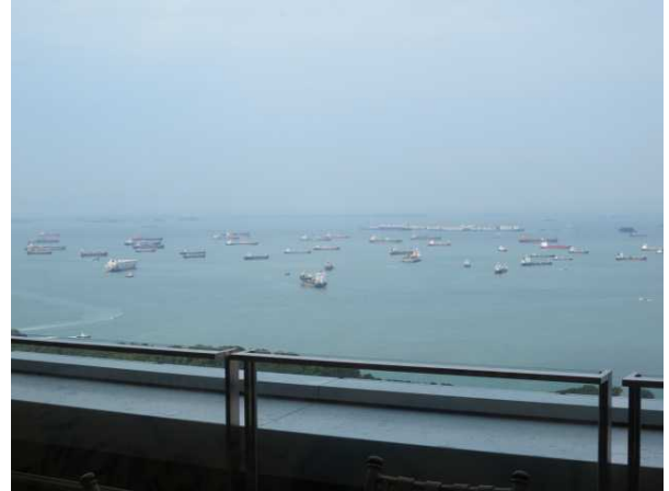
沖に停泊しているコンテナ船