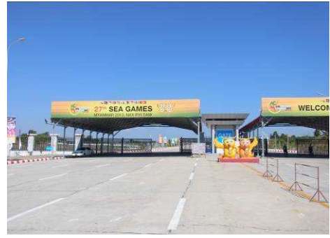
SEA Games 会場の入り口

ネーピードーは 2006 年に遷都された政治都市で、昨年訪れた際には政府機関の建物以外に何もなかった印象ですが、今年は SEA Games 開催に併せて、大型スタジアムや新しいホテルが数多く設置されていました。経済の中心地は現在でもヤンゴンですし、ネーピードーは不便な場所に位置しているので、大規模なスポーツ施設やホテルを作っても他の用途での活用が難しいと感じましたが、今年は ASEAN 議長国として会議開催時の使用等が予定されているとのことです。