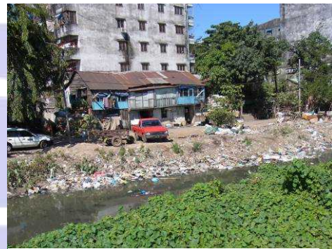
川沿いに廃棄された生活ごみ