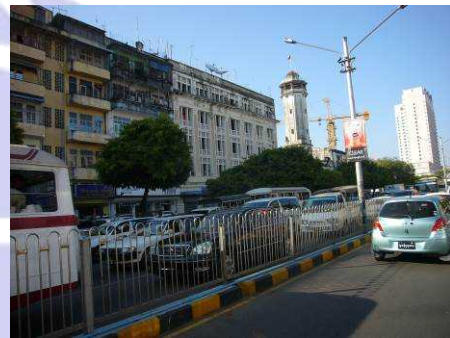
MIFF の入居する中央消防署

MIFF (Myanmar Foundation For Fire Safety and Rescue) を訪れました。MIFF は、消防及び救急分野で職員のスキルの向上や環境整備、住民への教育等の実施を目的に、政府の後押しを受けてNPOとして2013年に設立されました。2013年10月には日本の総務省消防局と