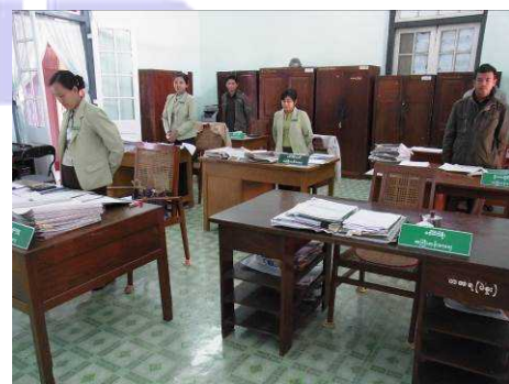
バゴー県事務所の様子

地域政府事務局としては、地方政府首相や大臣の秘書業務、農業・教育・保健などの分野における政策策定を行っています。個別の行政分野における施策については地域政府におかれている各部局が実施していますが、各部局とも総務局と同様、連邦政府の省庁の管轄下であり、連邦政府側に決定権があることも多いようです。なお、地方政府の事務方のトップである事務書記長は内務省総務局から派遣され、他部局を含めた地方政府全体の調整や政策決定に関与するなど、内務省が地方政府に対して影響力を持っています。