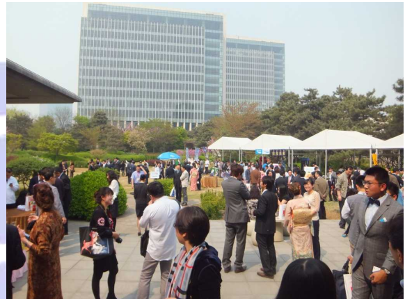
多くの来場者で賑わう中庭の様子