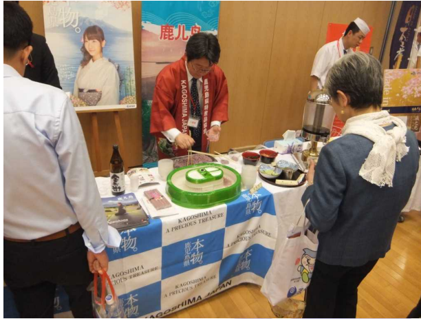
流しそうめんを実演する鹿児島県ブース

このように、どの自治体ブースにおいても、地酒や伝統工芸品の展示など趣向を凝らした展示内容で PR したことで、多くの来場者が各ブースで足を止め、各地の物産や観光パンフレットを実際に手に取り、楽しんでいる姿が見られました。