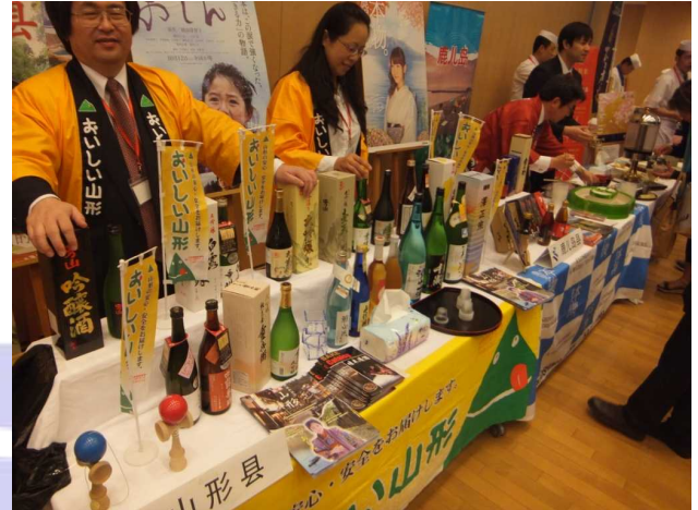
多くの日本酒が並ぶ山形県ブース