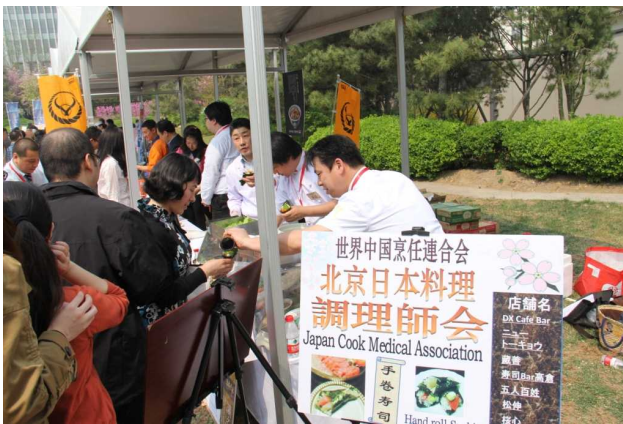
手巻き寿司が試食できるブースには行列も

クレア北京事務所としても、より多くの中国人に、日本の魅力を知ってもらえるよう、今後も自治体と連携しながら情報発信・各種 PR 活動を行うとともに、日中の地域間交流・民間交流をいっそう推進できるよう努力していきたいと思えます。