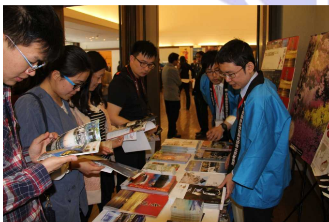
クレアブースでパンフレットを手にする来場者