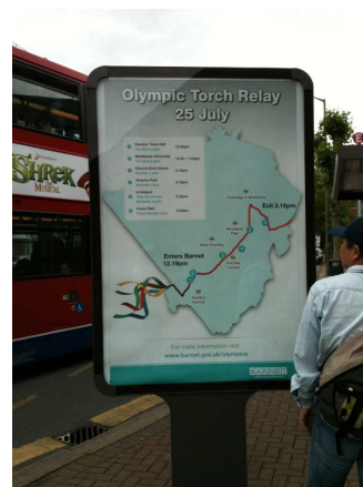
近所のバス停の広告スペースも聖火リレーの地図に。