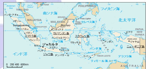
インドネシア地図 ( http://www2m.biglobe.ne.jp/ZenTech/world/info/ )

そして 300 以上の民族、約 250 種の言語、主な民族としてはジャワ人、スンダ人、バタック族、メダナ人、アンボン人、メナド人、ブキス族等は今でも民族独自の言語と独特の文化を持っている。