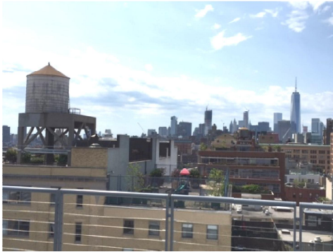
左はよくみかける給水設備 右手の高い建物は新しい 世界貿易センタービル

務付ける規制を導入し、早速、30日以内に所有者に届出を義務付けたようです。一住民としては、今後、行政の対応の結果がどうなるのか、注目していきたいと思います。