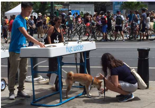
散歩中に水をもらう犬

とはいえ、日本でもそうですが、多くの人には「都会の水道水はおいしくない、安全でない」というイメージがあるのではないのでしょうか。そこで、ニューヨーク市が行っているのが「Water On the Go」キャンペーンです。夏のニューヨークでは、週末を中心に街中で様々なイベントをしていて、観光客も含めて多くの人、自転車が街歩きを楽しんでいます。そんな人が集まる場所に上の写真のような仮設の水飲み場が設けられ、誰でも水を飲めるようにしています。