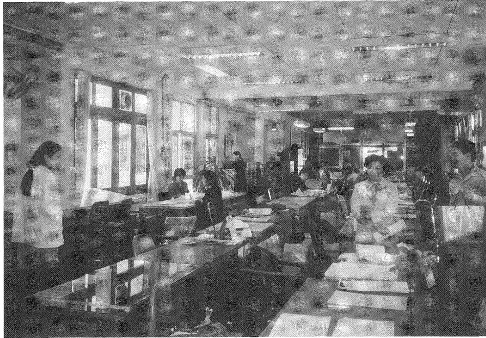
税務課(ナコン・ラチャシマ市)