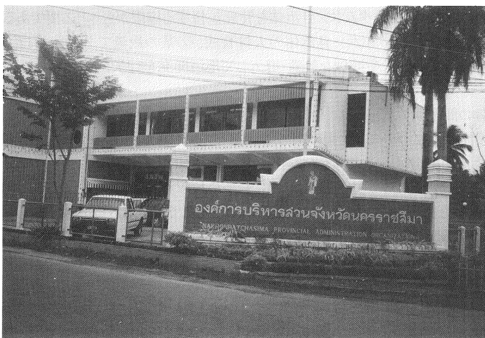
ナコン・ラチャシマ県自治体の庁舎

タイ東北部地域内の県の執行部で構成する組織(サマー・パーン)があり、また、その全国レベルの組織(サハー・パーン)もあり、これらは効率的な行政を推進するための組織で、研修企画等も行っている。