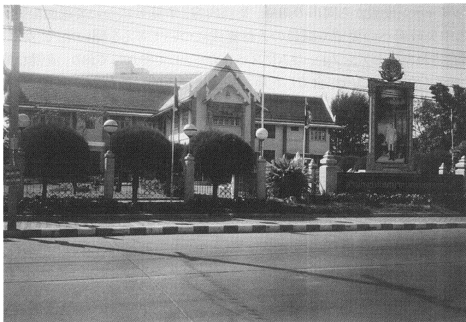
ナコン・ラチャシマ市庁舎

一方、同市はGIS (Geographical Information System) という地理情報システムを導入しており、周辺自治体からの視察もある。(同システムは市内の土地情報のデータベースを利用して、課税、下水道、道路整備等に活用している。ただ現時点では市内LANができていないため、関係課の職員が情報センターに足を運んでいるが、近くLANを整備する計画である。)