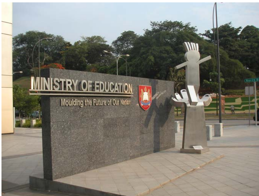
教育省 (Ministry of Education : MOE)

教育省の組織は12の部と内部監査部から構成されている (図表2-1-1「教育省組織図」参照)。