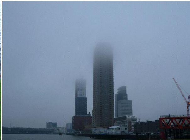
港湾地区の高層ビル群