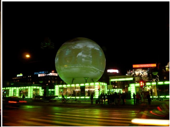
市庁舎広場前の特設会場