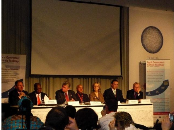
市長による共同発表