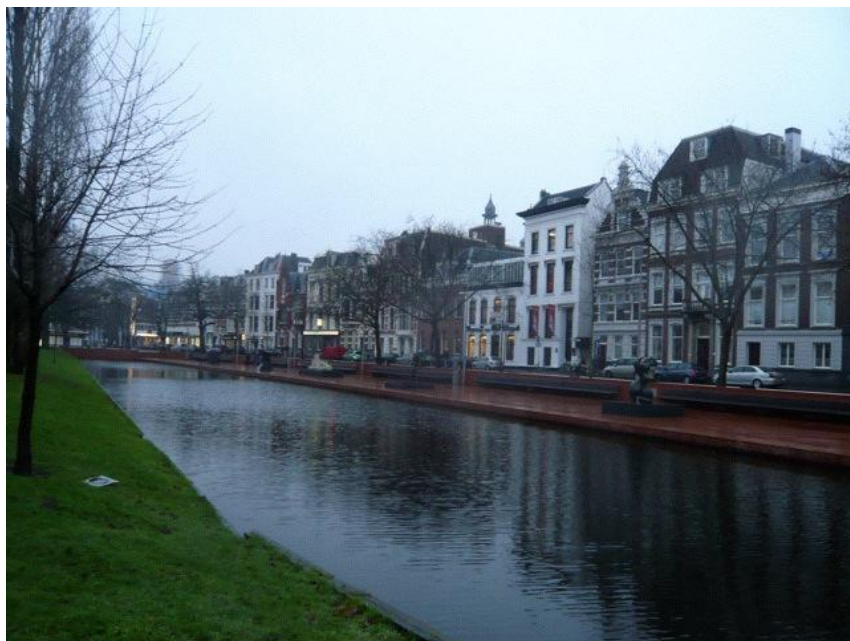
普段は公園として利用される貯水池