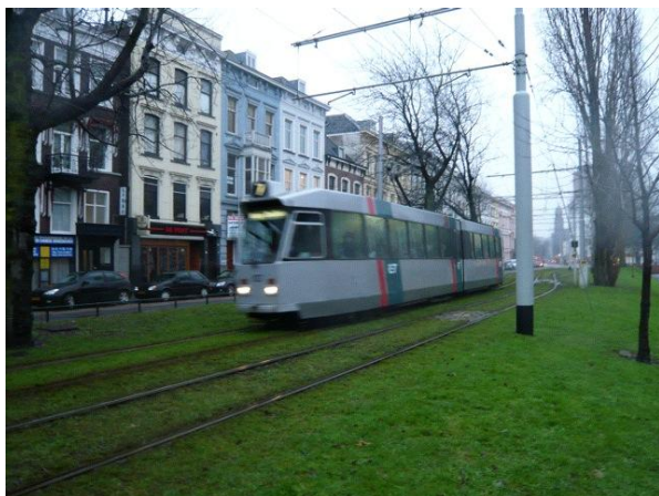
市内中心部を走るトラム