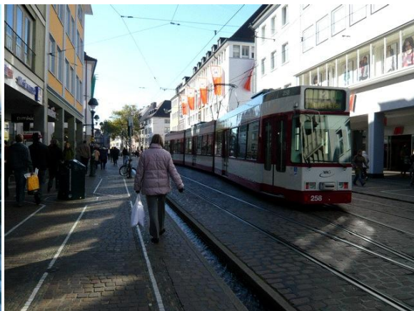
中心部のトランジットモール