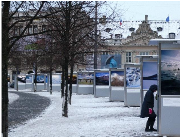
市内中心部の広場における野外展示