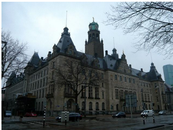
ロッテルダム市庁舎

ロッテルダム市はヨーロッパ有数の港湾都市であり、人口は首都アムステルダム市に次いでオランダ第2位の約60万人である。市内には市庁舎など戦火を免れた歴史的な建物から、斬新なデザインの近代的な建物まで様々な建築物が並び、「建築の町」として知られている。また市内には地下鉄、トラム、バスのほか中心部を流れるライン川の分流であるマース川では水上タクシーも運行され、公共交通が非常に良く整備されており、持続可能な街づくりが進められている。