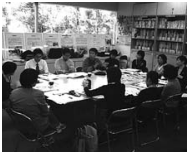
↑ワークショップの風景

合わせ、相談に対応するとともに、プラザを活用した企画展へのアドバイスやパネル、国際理解教育教材(フォトランゲージ)の貸出しを行っています。