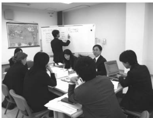
↑昨年度の全体会(上)と分科会(下)の様子