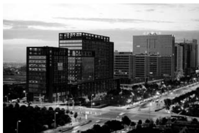
↑中国軽紡城国際貿易区

(財)自治体国際化協会 交流情報部交流親善課 TEL 03-5213-1723 FAX 03-5213-1742 e-mail: shimai@clair.or.jp