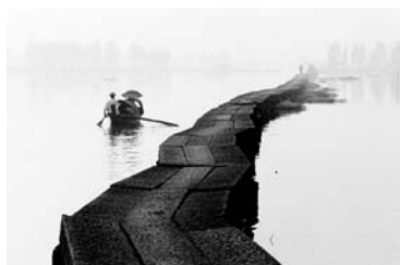
↑古織道（昔大きな船を接岸する際歩かために使われた水上の細長い石畳）

県の経済構造は、第二次産業が中心であり、特に紡績業が盛んで、世界最大の紡織製品の貿易市場である「中国軽紡城」