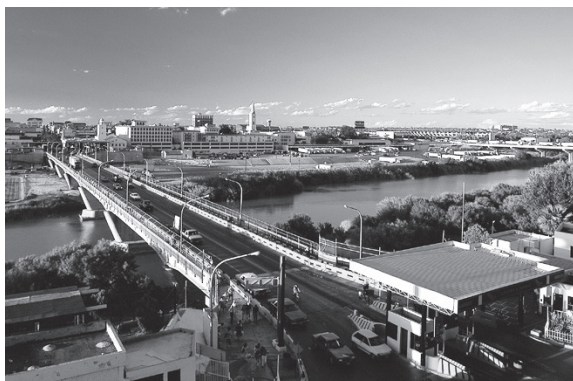
↑アメリカ橋 (Bridge of the Americas)

ティーの学生に対して積極的に機会を提供していることが認められ、『Greatest Opportunity for Minority Students (少数人種の学生に成功の機会を提供するよい大学)』全米第一位に位置付けられるとともに、二〇〇六年には最も優れたビジネススクールとして表彰されるなど注目を集めている大学です。少数ですが日本人学生も在籍しています。