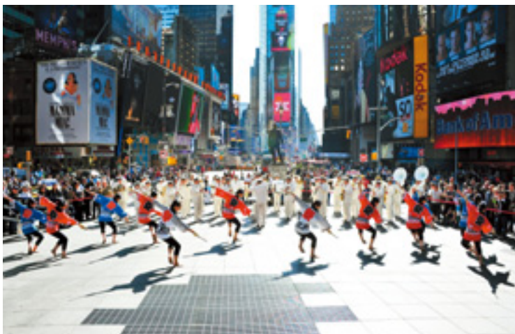
コロムバデーパレード (2010年10月11日 5番街) 1492年、コロンブスの北米大陸到達を記念して毎年行われるパレード (10月第2月 曜日) に警視庁音楽隊が参加。タイムズスクエアでは華麗な舞を披露。