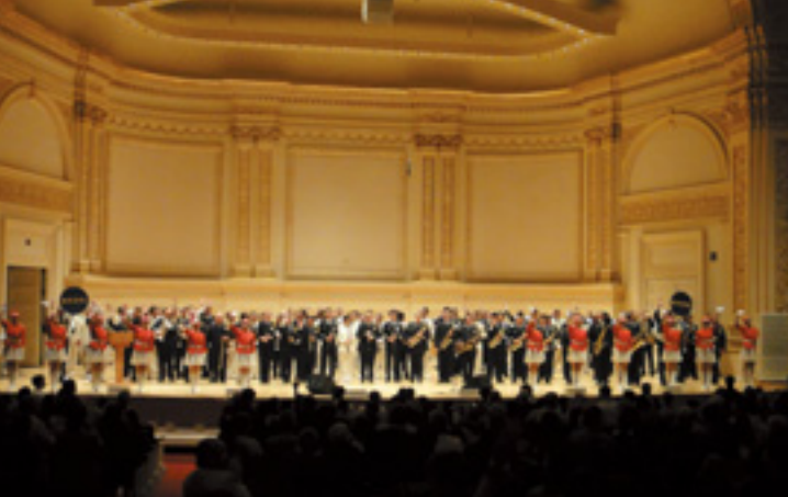
第15回世界のお巡りさんコンサート (2010年10月10日 於：カーネギーホール) 世界の警察音楽隊が音楽演奏を通じて交流を深めるため、1996年に 初めて東京で開催。ニューヨークでの開催は2000年以来2回目。