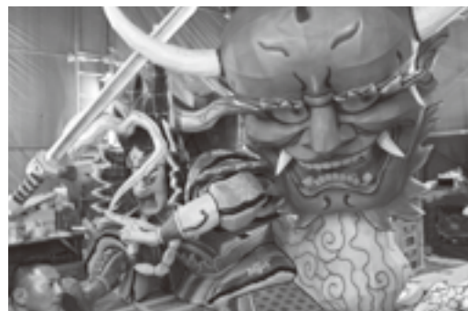
まだ小屋に置いてある完成したばかりの丸彫り（祭り初日）

青森には、五所川原市の「立ちねぶた」以外のねぶた祭りがあります。前任者のALTに、つがる市ねぶた祭りに参加しているグループを紹