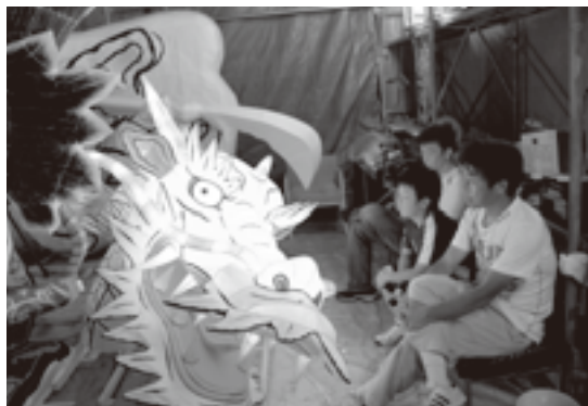
遅くまで作業する菟中ねぶた愛好会のメンバー、一時休憩中

まもなく、私は愛好会に加わりました。毎晩小屋に行って、遅くまで作業することになりました。最初は、和紙ですごく大きい馬の皮を作りました。簡単そうに見えますが、適切な丸さが大事で、狭くて貼りにくい所がいっぱいあるので、本当に難し