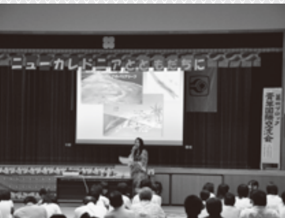
ニューカレドニアの文化紹介イベント

動を行うこと から始めまし た。私はフラン ス領である ニューカレド ニアで生まれ 育ったので、 岐阜県民にフ ランスの文化