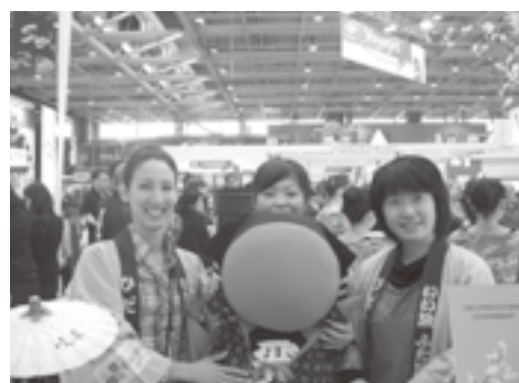
パリ観光博覧会にて（さるぼぼと一緒に）

また岐阜県は、清流長良川や下呂温泉、豊かな自然をはじめ、関市の刃物、美濃焼きや和紙、郡上市の食品サンプル作りな