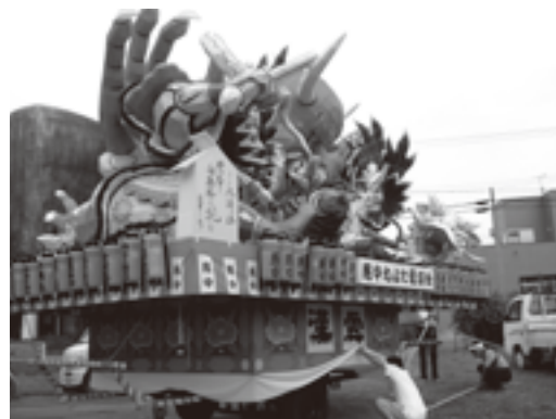
制作中の23年度の丸彫り