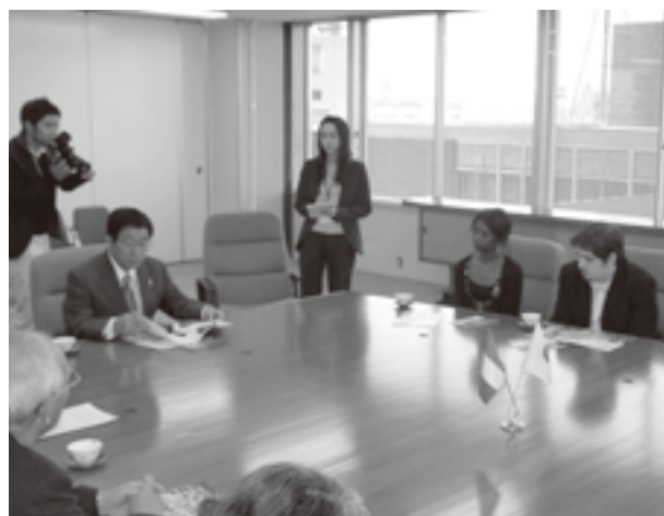
岐阜県知事とパリの漫画専門学校の留学生との面談を逐次通訳

また、もう一つ私が大きくかかわっている県の事業は、フランス語圏であるモロッコ、ウジュダ・アンガッド府との交流です。乾燥地であるモロッコの緑地化をサポートするため、JICAの事業を活用して、岐阜県の国際園芸アカデミーにモロッコ人研