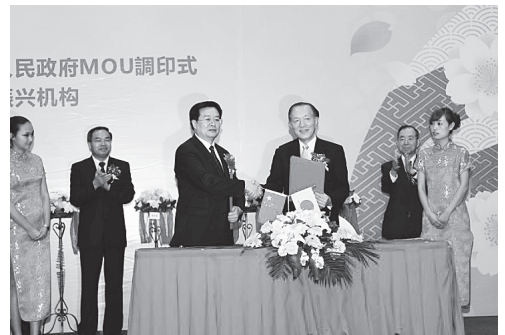
王国生湖北省省長（左）とジェトロ林康夫（右）前理事長が、業務覚書（MOU）を調印（2011年7月）

ちなみに、湖北省及び武漢市と日本の自治体との交流では、1979年から大分市が武漢市と友好都市関係を結び、大きな実績を築いています。本年10月には、広瀬勝貞大分県知事も訪問団を率い湖北省の各地を精力的に視察されていました。また、1994年に福島県が湖北省と「人材と技術の交流に関する同意書」を結び活動展開しています。ジェトロとしては、こうした自治体同士の活動がさらに充実したものになるよう、事業展開の面で連携を深めていきたいと考えています。