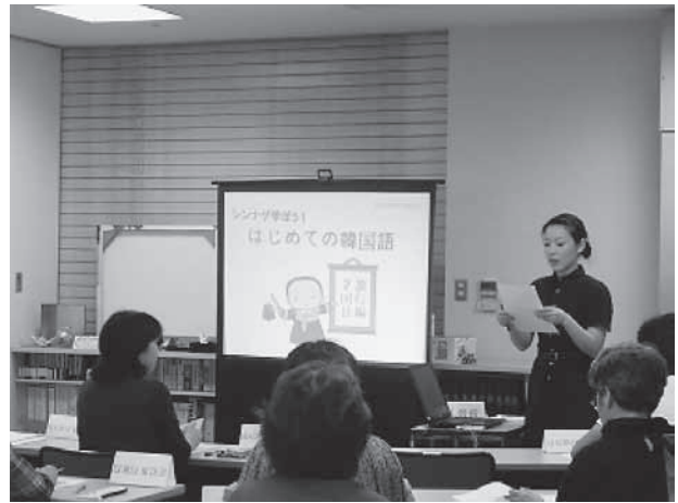
市民向け語学講座

三つ目としては、市民向け国際理解講座の実施があります。講座内容はクラフトや料理、映画を利用した文化紹介など、国際交流員はそれぞれの長を生かして企画・運営に携わっています。また、講師として学校や市民団体に派遣され、講演や文化紹介を行うこともあります。このほか、国際化に対応した職員養成のため、職員向けの基礎及び専門語学講座の講師も務め、職員の異文化理解の促進、語学力の向上にも貢献しています。