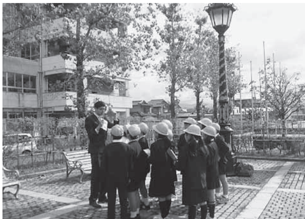
姉妹都市公園での姉妹都市紹介

また、金沢市には7つの姉妹都市を表現したコーナーが配置された姉妹都市公園があります。この公園は、市民のみなさんに姉妹都市に親んでもらい、より活発な交流が広がっていくことを願い、整備されました。そこで、より多くの方に公園を訪れてもらい、姉妹都市交流を知ってもらうため、公園の各姉妹都市コーナーにおいて、それぞれの国際交流員が、姉妹都市や母国の紹介を行う講座を開講しました。一度に異なる5か国の人と交流ができ、様々な国や都市の話が聞けることから、参加者には好評を得ました。同時に、参加者はもちろんのこと、メディアをとおしても講座の様子が流され、姉妹都市交流をより多くの方に知ってもらうよい機会となりました。