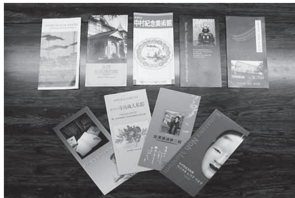
文化施設多言語パンフレット [英・中(簡体字/繁体字)・韓]

金沢市は現在、2015年の北陸新幹線の開業を控えており、首都圏が身近になることによる交流人口の拡大が期待されています。このことを見据え、国際交流員は、日本人とは異なる海外観光客の視点から、市内文化施設の来訪者向けパンフレットや案内看板、地図などの作成において助言や翻訳を行っています。また、近年、金沢市ではMICEの開催が増えてきました。今年度は、世界の一流シェフが石川県に滞在し、郷土素材や器を利用して料理を創作する「Cook It Raw (クック・イット・ロー)」や、世界の学識者が集った「城下町金沢国際ワークショップ」などが開催されました。このような場においても、国際交流員は金沢の文化を理解する翻訳・通訳者として活躍しています。世界に開かれた都市づくりを目指す金沢市にとって、MICE誘致は今後も力を入れる取り組みのひとつであり、国際交流員の活躍の場はますます増えていくものと思っています。