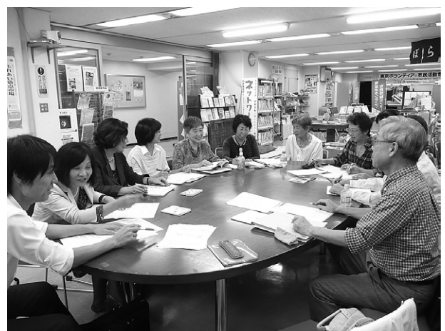
「わかる日本語」研究会のメンバーが円卓を囲んで

これらの事業を通して自治体、地域団体、NGO/NPO・市民団体等との相互連携を深め、浮かび上がってくる課題（特に“生活とことば”）をTNVNでも取り上げていきます。