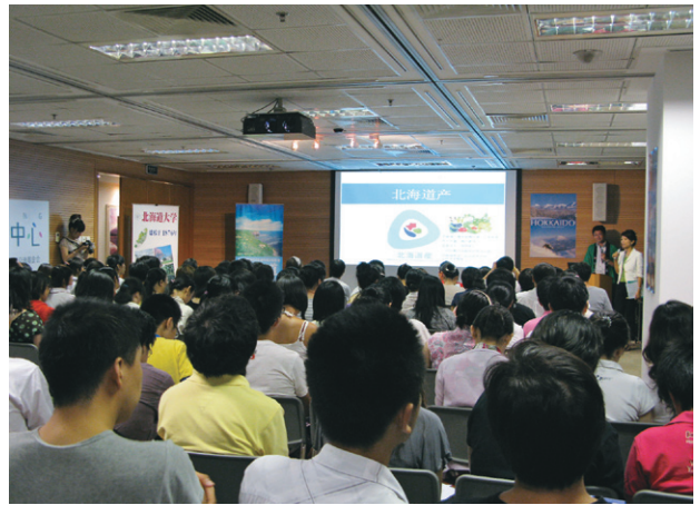
2010年8月に当センターで開催した都道府県紹介シリーズ（北海道編）の様子

中国に限った「ツボ」ではないと思うが、上記のような「体験型」イベントや「ライブ」ものの人気はやはり高く、これはインターネットが提供できない価値であろう。われわれが参画した公演事業は数多くあるが、昨年10月のNHK交響楽団北京公演を筆頭に、いつも好評を博している。また、小型の参加・体験型イベントの例には、2012年から継続して行っている「和文化体験倶楽部」（通称「和のコラボ」）があり、これは宣伝開始後すぐに参加者の枠が埋まってしまう人気企画である。このイベントでは、浴衣の着付け、折紙、書道、百人一首、華道などのうちからいくつかを組み合わせて北京在住の