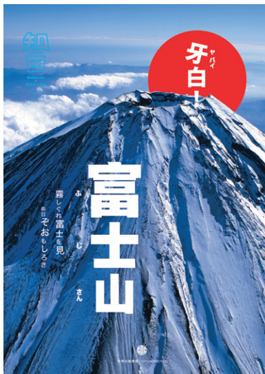
「富士山」特集号 (通巻 33 号、2015 年 12 月発行)

の文化、エンターテインメント、ライフスタイルに関する記事を発信する体制にしています。毎週 1 回、定例会議があり、その前の週の「微博」「微信」の成績を分析しています。