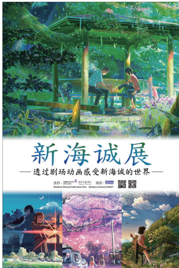
新海誠展のポスター・チラシ

以下、紙幅の許す限り、当方が過去に実施・関与したイベントの例をご紹介します、併せて日頃の経験から学んだ