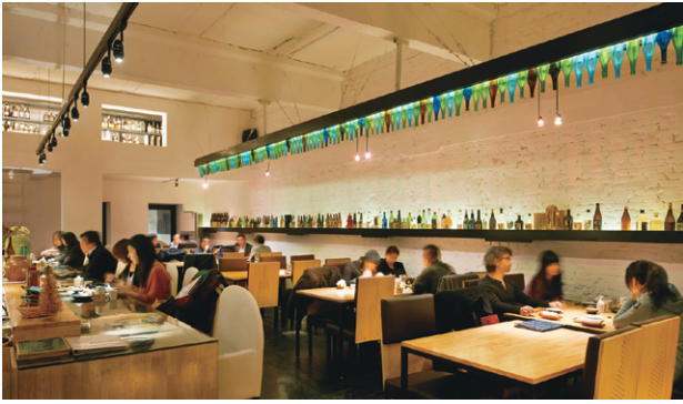
自社で管理する日本酒ダイニング sakeMANZO。多くの中国人が日本酒を飲む

ある。とりあえずビールもなく、いきなり日本酒。数人で1本開けて飲む。ワインと同じような感覚だろう。人気は価格の手頃な純米酒や純米吟醸。日本と同じく、香りの高いもののほうが好評のようだ。