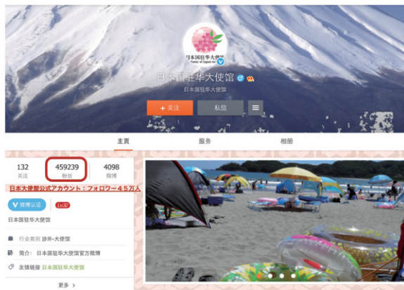
日本大使館の「微博」ページ

中国にとって、日本のコンテンツは海外のものなので、当然日本で人気があるものから輸入されていく傾向にある。例えば、男性アイドルで言えば「嵐」、女性アイドルで言えば「AKB48」など、どの分野でも代表格のコンテンツから紹介されていく。基本的に、海外のコンテンツ情報はインターネット上で広がっていくため、ユーザーも受動的ではなく能動的に情報をキャッチしようとする。例えば「微博(中国版Twitter)」では日本大使館のアカウントで45万人、私設の日本情報発信アカウントで多いものは1,000万人以上のフォロワーを有している。これだけ多くの人々が日本の情報を欲しており、そ