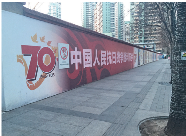
「中国人民抗日战争胜利」70周年に北京市街のあちこちに現れた標語