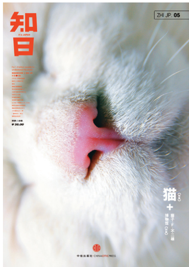
「猫」特集号の表紙 (通巻5号、2012年8月発行)

毎号平均4～5万部前後を売り上げ、人気の号は重刷され、さらに部数を重ねていく。中国の出版関係者間では書籍で1万5,000部を超えればヒット作とみなされるのがおよそ通例なので、『知日』は間違いなく好成績のシリーズ。制作総指揮にあたる蘇静氏にその人気の背景と今後の展望を聞いた。