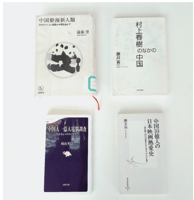
中国での日本文化の受容状況を知るための参考図書。例。城山英巳『中国人一億人電腦調査 共産党より日本が好き?』(文春新書、2011年)、遠藤誉『中国動漫新人類—日本のアニメと漫画が中国を動かす』(日経BP社、2008年)、劉文兵『中国10億人の日本映画熱愛史』(集英社新書、2006年)、藤井省三『村上春樹のなかの中国』(朝日選書、2007年)

一方、中国国内において、日本文化が無条件かつ全面的に肯定されているわけではないのも現実である。中国の人々にとって日本や日本文化は、政治的な文脈に置かれると途端に敷居が高くなる。日中間には今も歴史問題が横たわり、人々の日本に対する感情にも複雑なものがある。文化や芸術と政治は関係ないと思われる読者もおられるかもしれないが、誤解を恐れず言えば、中国においては文化もまた政治であり、国の制度もまた文化や芸