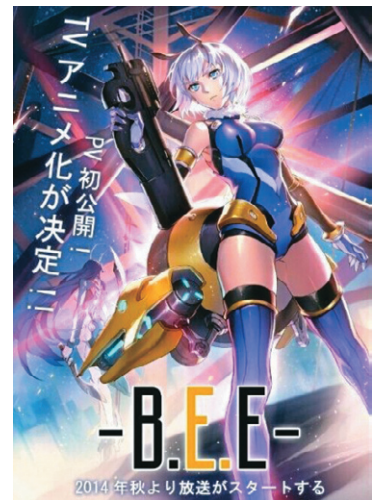
中国アニメ「雛蜂」日本語ポスター（実際の放送は2015年夏～）

40代以下の大勢の中国人に影響を与えているコンテンツとして、日本と中国の政治関係が不安定な時期にも関わらず、中国における独自ビジネスになり、さらに中国国産アニメ・漫画ビジネスのモデルケースにもなっている。政治の壁や国境を越え、アニメ・漫画コンテンツは、中国ではサブカルチャーとして、そして新興ビジネスとして、これからも新たな文化を生み続けるであろう。