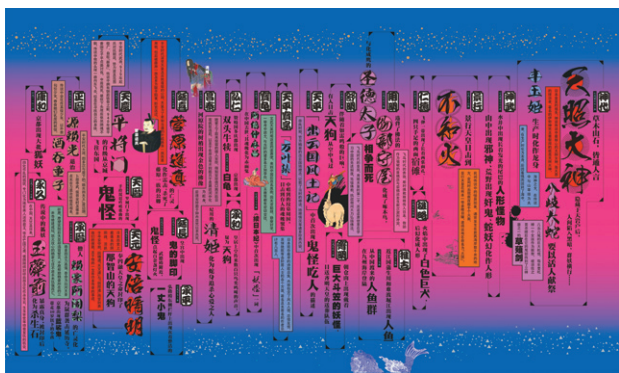
「妖怪」特集号の誌面（通巻8号、2013年2月発行）

1993年より北京在住。日本の雑誌、機内誌を中心に中国のライフスタイル関連の取材、執筆をひろく手掛ける。主な著書に『踊る中国人』『中国の買い物キッチン』『中国の賢いキッチン』『北京上海 小さな街物語』『踊る！大北京』『歳時記 中国雑貨』、共編書に『在中日本人108人の それでも私たちが中国に住む理由』など。