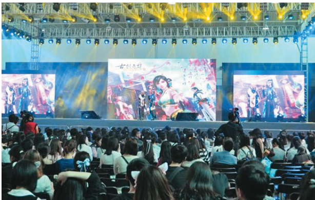
上海でのイベント「ACG」は大盛況（2016年5月）

イベントの開催地としては、規模と回数の点で上海がトップである。毎年、数十万人規模の「CCG Expo」、 「CHINA JOY」という2大コンベンションと、「COMIC UP」、 「ACG」などの民間コンベンション、1万人規模ライブイベント「BILIBILI MACRO LINK」が開催されている。