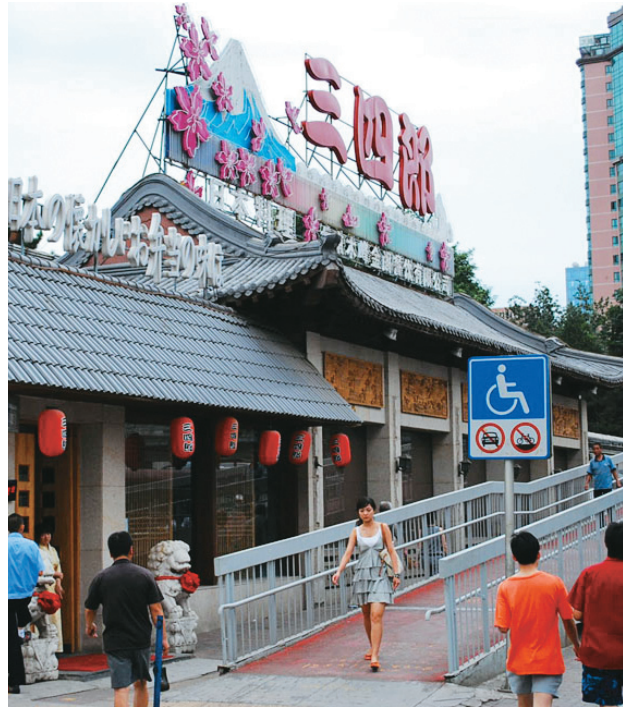
2000年当時からの老舗の日本料理店（北京市）

日本料理店の内容も細分化が進み、寿司、焼肉、焼鳥専門店はもちろん、懷石や蕎麦屋まである。安い食べ放題の店もあるが、銀座の超高級店も出店している。非常にバラエティーに富んでおり、欧米に比べると比較的手