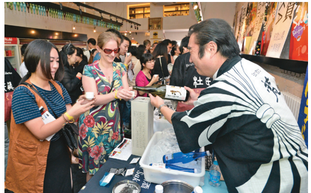
Sake Carnival 2015 Beijingの様子。

今後も、まだまだ中国での日本料理人気は続くと思われる。筆者も日本酒を通じて、日本文化の紹介に貢献できれば幸いである。