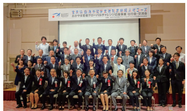
おかやま若者グローバルチャレンジ応援事業の壮行会 多くの協賛企業などに支えられ、留学にチャレンジしています。

県では、2015年度から産学官が連携して「おかやま若者グローバルチャレンジ応援事業（トビタテ！留学JAPAN 地域人材コース）」を実施しています。県内大学生などの「留学したい！」という熱意に地元経済界などが応援団として応え、未来の岡山に貢献するグローバル人材が育つことを楽しみに、毎年学生を海外へ送り出しています。そして、留学した学生たちはそれぞれ日本では得られなかった「何か」を持ち帰っています。