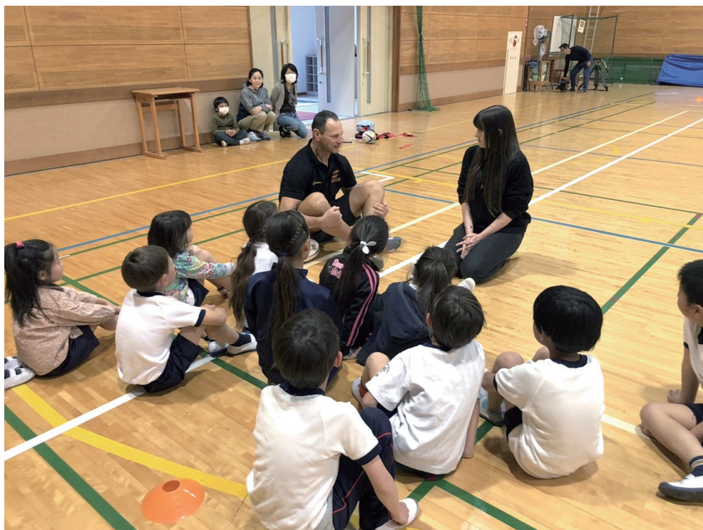
中学校でのオーストラリアラグビーチームの交流会の様子（写真右上が CIR）

しています。他にも面白いことがあれば投稿しています。これは、言葉の問題を抱える観光客や住民が英語で情報を得るためのアシストにもなるはずです。別府市に来てから9カ月で、Facebook では250人以上、Instagram では100人以上のフォロワーを集めました。小さな取り組みかもしれませんが、まだまだ進化しており、別府市への関心が徐々に高まっているのを感じています。