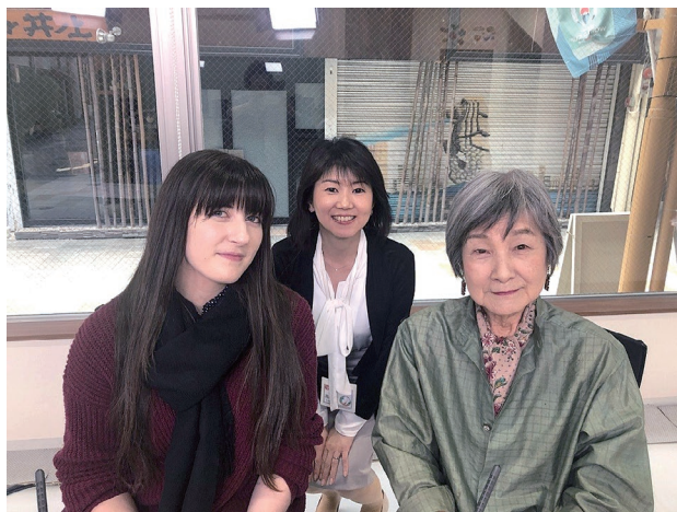
ケーブルテレビでの収録後の様子（写真左端が CIR）

JET プログラムへの参加が決まった時、私はイギリスの回転寿司屋でバイト中でした。本選考に漏れ、補欠通知のメールが来てから2カ月、日本行きを諦めかけていたタイミングで、もうチャンスは無いかな…と思っていたので、その朗報に夢心地になりました。でも、赴任までたった2カ月。急いで準備しないと…とすぐに気付いたのでした。