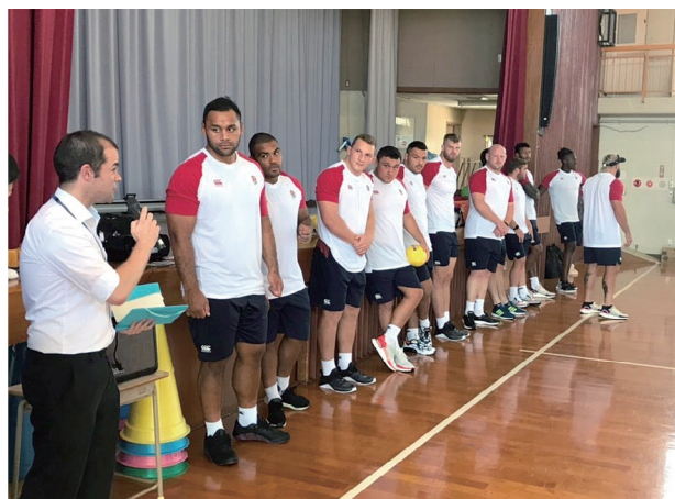
イングランドラグビーチームが特別支援学校を訪問した際の通訳の様子

翻訳・通訳以外の業務だと、取りまとめ団体アドバイザーとして県内JETプログラム参加者のカウンセリングを行ったり、宮崎県国際交流協会で窓口対応のお手伝いもしています。そして、県内の小学校から大学までを