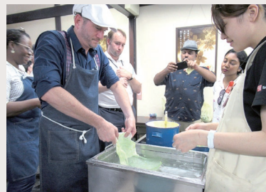
岐阜県郡上市にて、食品サンプルづくりを体験する駐日大使ら

として海外にPRする「飛騨・美濃じまん海外戦略プロジェクト」を進めています。帰国後は、海外戦略推進課にて、同プロジェクトの一環として実施される年