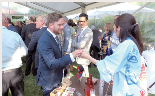
天皇誕生日祝賀レセプション出展の様子

数回の知事トップセールス時のロジ調整や各事業担当課のサポートのほか、駐日大使等に岐阜の魅力ある観光地を紹介するバスツアーの企画・運営、在外公館が主催する天皇誕生日祝賀レセプションへの出展などを担当しています。