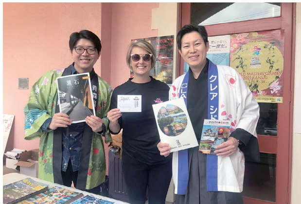
South West Festival of JapanでWMG2021 関西のPRや日本各地の観光PRを行うクリアシドニー事務所職員(左、右)

2019年9月8日、クリアシドニー事務所は、西オーストラリア州のバンバリー市で開催された「South West Festival of Japan」にブース出展し、バンバリー市の姉妹都市である世田谷区や日本各地の観光PRを行い、また、WMG2021 関西のPRも行いました。