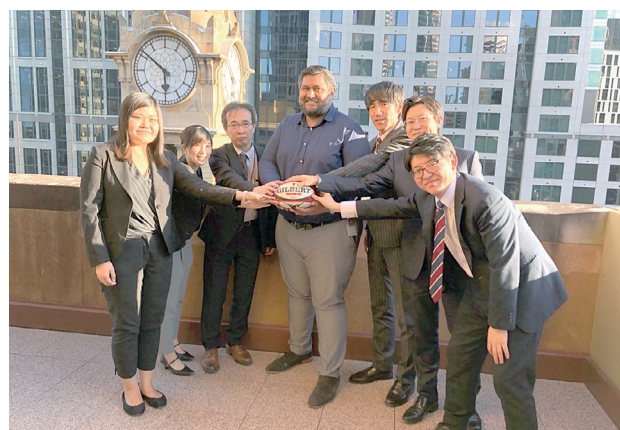
WMG2021 関西組織委員会事務局職員とブラックタウンラグビーユニオンフットボールクラブの代表者、クリアシドニー事務所職員の集合写真

その他にも、クリアシドニー事務所は、WMG2021 関西組織委員会がオーストラリア滞在中に訪問すべき関係機関について助言を行うとともに、その訪問のためのアポイントメント取得を行いました。