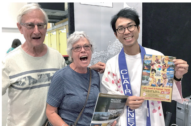
オークランドジャパンデイ 2020 への来場者に WMG2021 関西のPRを行うクリアシドニー事務所職員(右)

クリアシドニー事務所は、当イベントに初めて出展し、在オークランド日本国総領事館とJETAA(元JET参加者の会)オークランド支部の隣にブースを構え、日本各地の観光情報のPRやWMG2021 関西のPRを行いました。オークランドでは、2017年に前回の