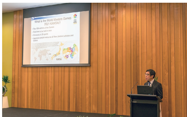
SCNZ カンタベリー地域姉妹都市フォーラムで WMG2021 関西の PR を行うクレアシドニー事務所職員

クレアシドニー事務所は、クレアの活動概要を紹介するとともに、WMG2021 関西をはじめとする大規模国際スポーツ大会について、姉妹都市交流の観点からプレゼンテーションを行いました。