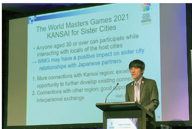
SCNZ カンファレンス 2019 で WMG2021 関西の PR を行うクレアシドニー事務所職員

クレアシドニー事務所は、日本で連続して開催される大規模国際スポーツ大会を PR し、特に WMG2021 関西について、市民の参加を通じた姉妹都市交流を促す観点からプレゼンテーションを行いました。