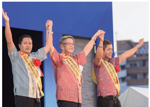
「世界のウチナーンチュの日」制定の宣言（2016年）