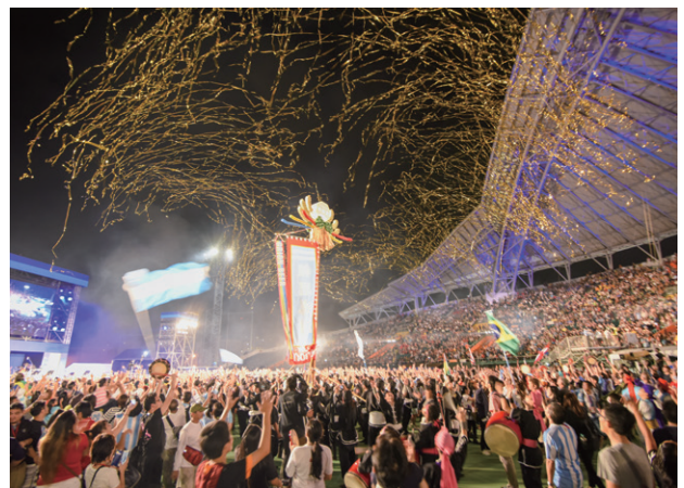
第6回世界のウチナーンチュ大会（2016年）

世界各国のウチナーンチュと沖縄県民のネットワークを作ることを目的に、1990年に「世界のウチナーンチュ大会」が開催されました。これは母県・沖縄にウチナーンチュが一堂に集う大イベントで、その後、概ね5年に一度開催されています。第1回大会では約2,400名だった参加者は、2016年の第6回大会では、約7,300名に増加しています。本年10月に予定していた