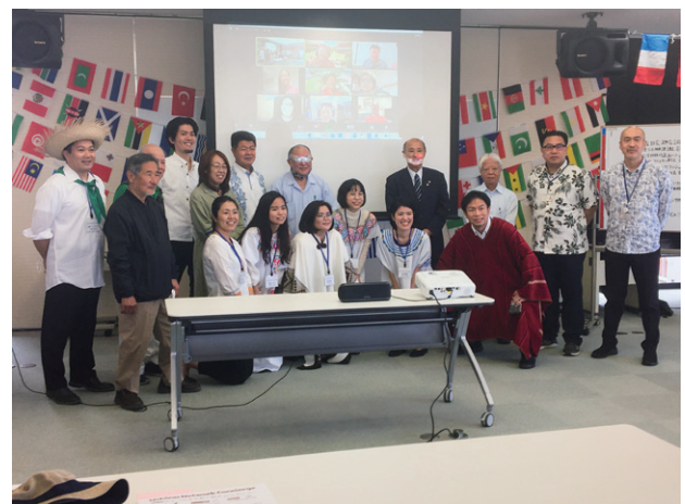
Uchina Network Concierge (ウチナーネットワークコンシェルジュ) 事前お披露目会 (2021年)

ウチナーネットワークのプラットフォームについては、海外沖縄県人会等から、概ね5年に1度の世界のウチナーンチュ大会に限らない、人的ネットワークの維持・オンラインを含めた継続的な交流の必要性などについての意見を踏まえ、国内外のウチナーネットワーク関係者の交流拠点として設置しました。