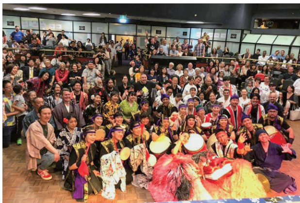
シドニー（オーストラリア）沖縄県人会にエイサーなどの沖縄の伝統芸能の指導者を派遣した際のイベント（2019年）

沖縄県はこうした「①海外や県外に移住した沖縄県出身者やその子弟であるウチナーンチュ」のほかに、「②沖縄県民」「③沖縄と縁のある人々」が文化や経済など多様な分野で交流し、形成されるネットワークのことを「ウチナーネットワーク」と定義し、世界のウチナーネットワークの継承と発展に向けてさまざまな取り組みを行っています。ちなみに「ウチナー」とは方言で「沖縄」を意味することばです。