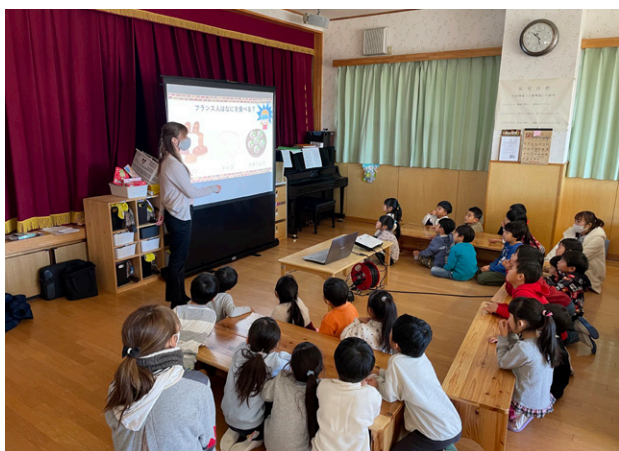
保育園でのフランス文化交流会

CIRがこれからもさらに多くの市民と関わり合いを持ちながら、富岡市の国際化を図っていけるように努めて参ります。