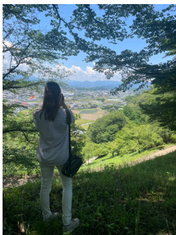
PR動画の撮影の様子

どのプロモーションをしています。主音声は母国語のフランス語ですが、より多くの方にご覧いただけるよう、英語と日本語の字幕も表示できるように作成しています。