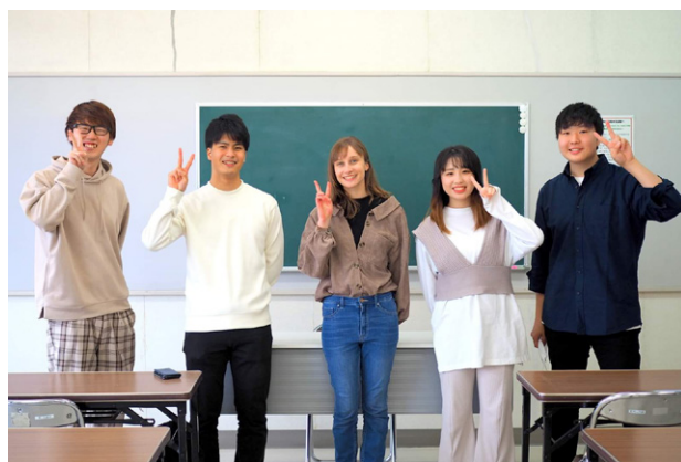
「みんなのおうえん団」の大学生ボランティアとの写真