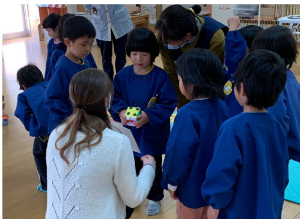
保育園での英語交流会