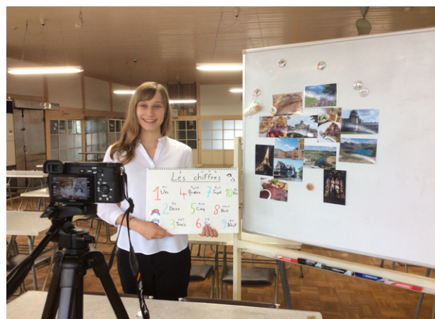
フランス語講座の撮影の様子