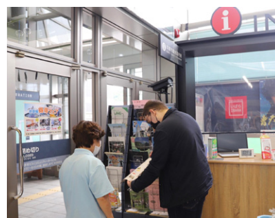
井原市観光案内所で観光案内をする様子

そして特に誇りを持っている仕事は、在住外国人のためのガイドブックを作る仕事でした。協会の理事と国際交流ボランティアの皆様が力を合わせ、「外国人のための防災、暮らしのルール・マナーガイドブック」を3カ国語（やさしいにほんご、英語、中国