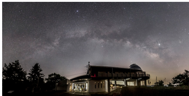
美星天文台と天の川(美星町)

む国際認定制度ダークスカイ・コミュニティ部門に申請し、秋頃に認定される予定です。認定されれば、アジア初となります。