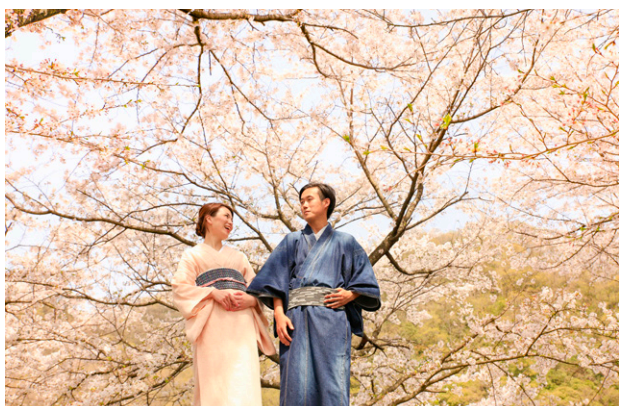
井原堤で井原デニム着物を着て花見する様子

HP : www.ibaracir.wixsite.com/visitibara