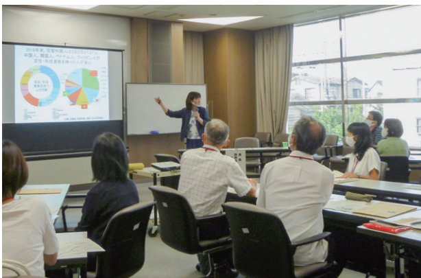
静岡市における多文化共生の状況と意義について学ぶ

2020年度、このプログラムに、地域における多文化共生の担い手を育成する「多文化共生サポーター養成講座」が新たに加わりました。市内で生活する外国人の力になりたいと思っている人たちが、座学やグループワークを通して、多文化共生の基礎知識を身に付け、地域での活動に活かすことをねらいとした市主催の講座です。