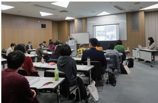
受講生の発表「多文化共生サポーターとして」

この担い手となる受講生が、限られた時間内に、外国人住民の抱える悩みを理解し、課題解決の想像力を培うことができるよう、外国人住民や留学生を交えたグループワークを取り入れたり、「やさしい日本語」を学ぶ機会を設けたことは、受講生の満足度を高める成果に結びついたと考えています。