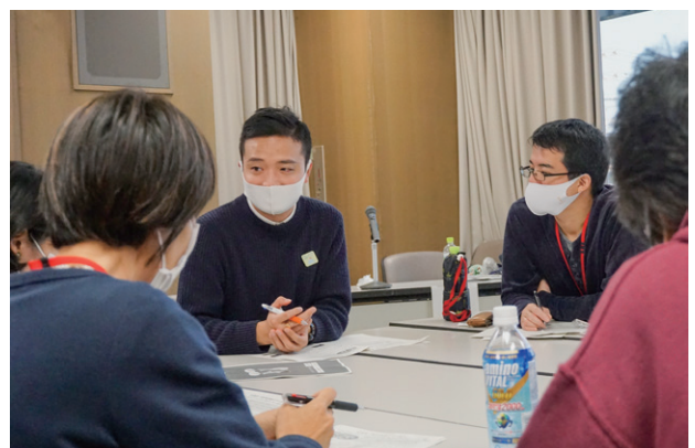
中国人留学生とのグループワークでやさしい日本語を学ぶ

静岡市には、いろいろな国籍の外国人住民が広い地域の諸所に住んでいるという特色があります。このため、身近な地域の中で国籍を問わず交流を深め、助け合い、より良いまちづくりをともに進めていくことを浸透させる必要があります。