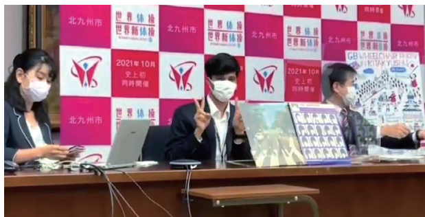
2022年の世界体操開催都市であるイギリス・リバプールと本市がオンラインでエール交換を行ったときの通訳者

北九州市の国際交流員（CIR）として、北九州市役所が発行した書類を、市に住む外国人や海外に送付する前に、翻訳・確認を行う責任があります。また、特別な行事やイベントの通訳をする機会もありました。