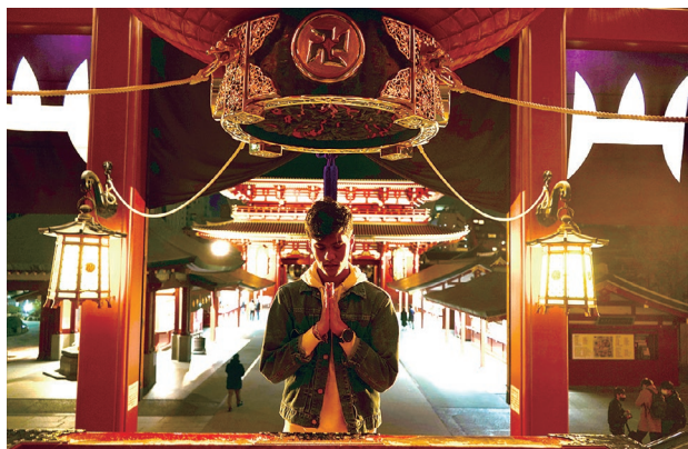
東京の浅草寺で参拝

普段、自分の名前はカタカナで書くのですが、漢字では、「利社舞」と書いています。大学の先輩が私に名前を付けてくれました。いただいたこの漢字は、私が日本の社寺と歌舞伎のような伝統文化を愛していることから考えられ、私自身も実際の自分によく合っていると思います。