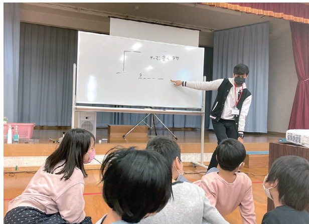
北九州市にある市民センターでアメリカ文化講座（アメリカ文化や社会のことを北九州市民に教える）

私は、組織委員会がアスリートのために行った日本文化ショーケースのMCを担当しました。それは、今までのCIRとしての私のベストな経験です。