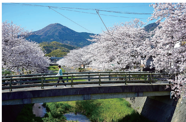
北九州市小倉南区で初九州花見

東京にいる日本人の友達に「北九州に引っ越す」と言った時、「北九州の危ない話を聞いたことがある」と心配されましたが、北九州の人と話をしたり街での暮らしを体験したところ、実は北九州はとても安全で、みんなとても素敵だということがわかりました。北九州は山と海に囲まれたとても美しい街で、これまでに訪れたどの都道府県でも経験したことのない魅力と雰囲気を持っています。北九州は東京に比べてはるかに静かで、ジブリ映画のように感じられる美味しい海鮮や美しい風景があり、東京のように混雑していません。