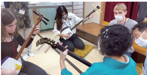
2021年、千葉県ウィスコンシン協会主催のウィスコンシン州出身新任ALT(外国語指導助手) 歓迎会における和楽器演奏体験

ウィスコンシン州は、アメリカの中西部に位置し、工業・観光産業・酪農業のバランスの取れた工業州です。同州とは1990年に姉妹提携し、2004年に千葉県側に千葉ウィスコンシン協会が設立されて以降は、県民が主体となって、文化・教育の分野を中心に相互に友好使節団の派遣・受入をするなど、交流が進んでいます。