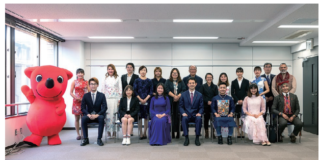
2022 年、「チーバくんパートナー」任命式

一方、県民向けには講演会を開催して、多文化共生意識の醸成を図っています。また、県内企業からの依頼に応じ、多文化共生に係る現状と取り組みなどについて理解を深める講義を実施しています。