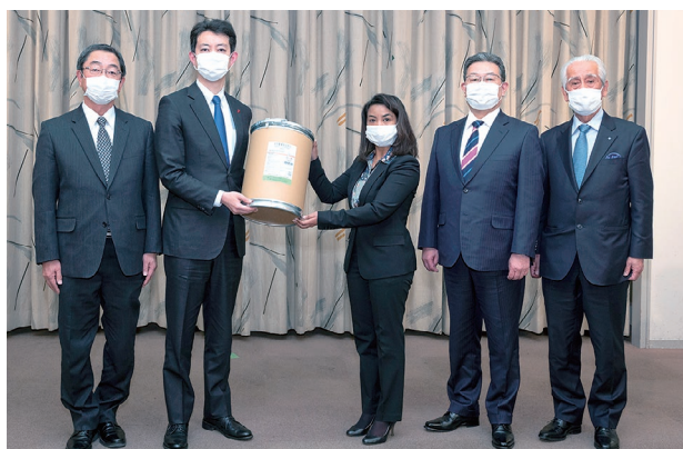
2022年、マダガスカル共和国へのヨウ素贈呈式

日本は世界の約35%のヨウ素を産出しており、日本国内で生産されるヨウ素の約8割が千葉県産です。海産物に乏しいマダガスカル共和国ではヨウ素欠乏症が深刻な問題となっていることから、日本ヨウ素工業会・成長科学協会・京葉天然ガス協議会と連携し、2018年から同国にヨウ素を提供しています。