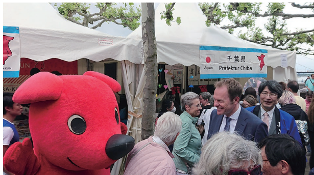
2022年、「日本デー」における千葉県PRブース

デュッセルドルフ市は、ドイツ西部に位置し、欧州第3の規模の日本人コミュニティが存在するなど、日本人にとって大変重要な都市となっています。同市とは2005年以降、スポーツ・経済・文化など幅広い分野での交流を続け、2019年5月に姉妹都市になりました。千葉県では例年、同市で開催される大型日本紹介イベント「日本デー」に参加しており、3年ぶりの開催となった2022年5月も、60万人とされる来場者に対し千葉の魅力を発信しました。